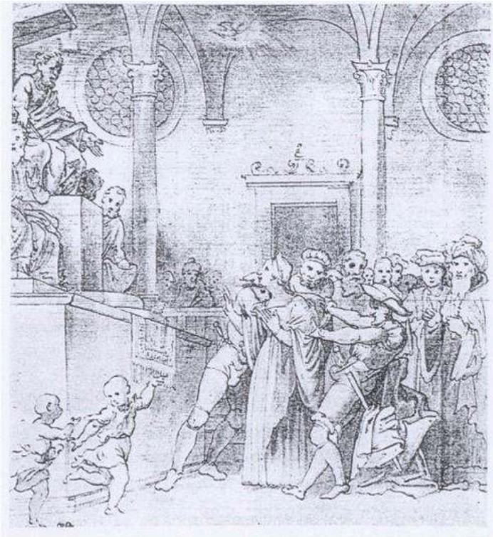
Lorenzo Lotto (copie d'après), Sainte Lucie devant ses juges , c. 1523, Paris, Musée du Louvre, Département des arts graphiques.