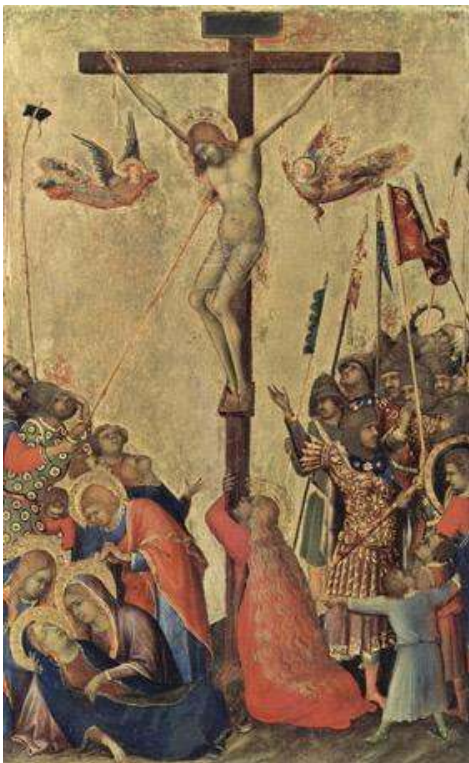
Simone Martini, « Crucifixion », Polyptyque Orsini ou Polyptyque de la Passion du Christ , c. 1333–1340, Paris, Musée du Louvre ; Anvers, Musée Royal des Beaux-Arts ; Berlin, Gemäldegalerie.