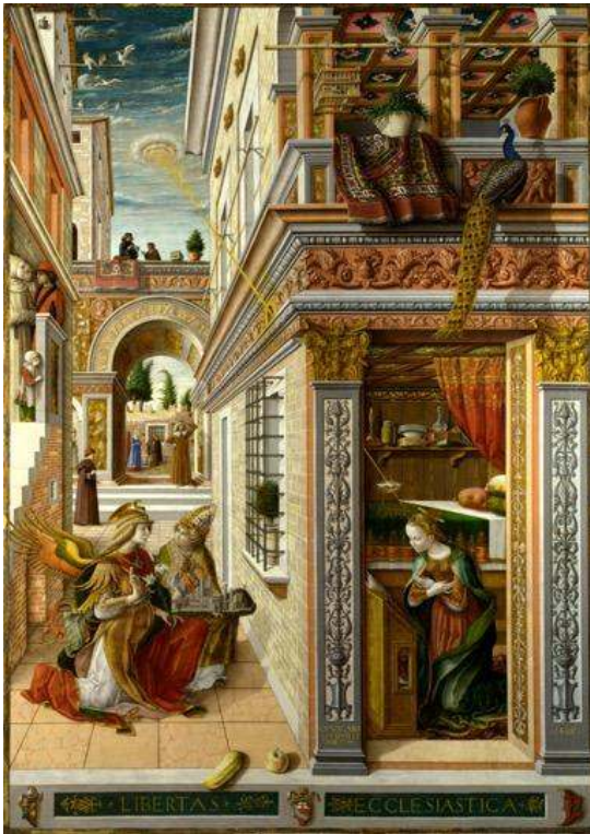
Carlo Crivelli, Annonciation en compagnie de saint Emidius , 1486, Londres, National Gallery.