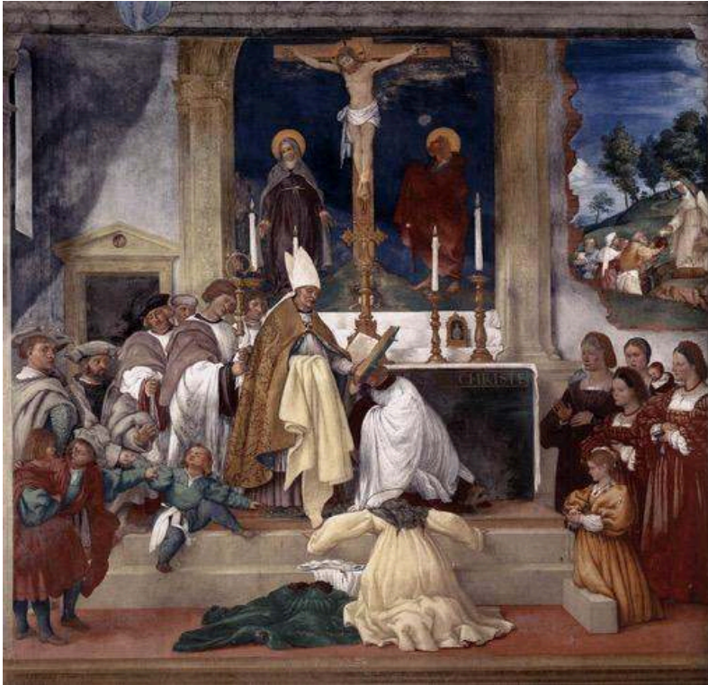
Lorenzo Lotto, Histoire de sainte Brigitte ; Sainte Brigitte prenant l'habit monacal, c. 1524, Trescore, Oratoire Suardi.