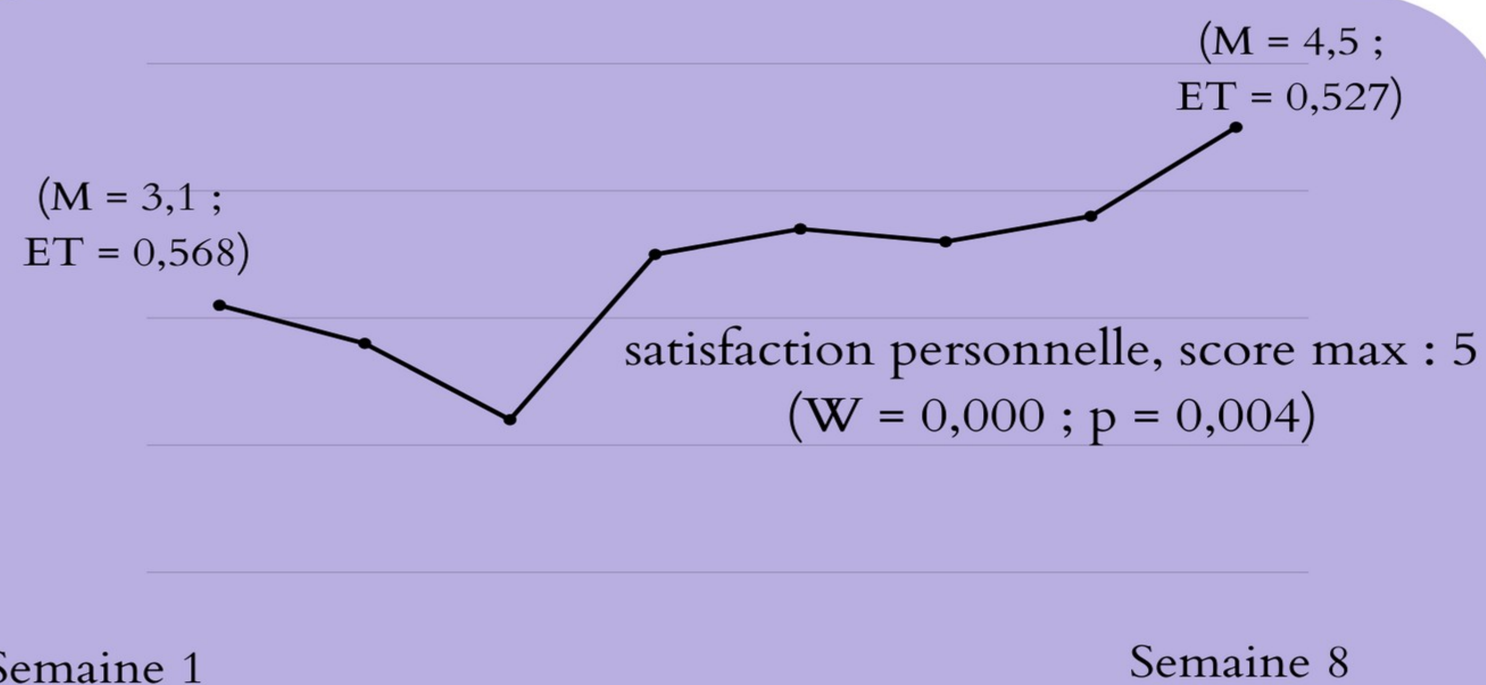
Figure 2 : Evolution du niveau de satisfaction personnelle à participer aux ateliers

D'un point de vue qualitatif, avant le début de l'étude, 7 participants exprimaient une réticence à participer aux ateliers mais rejoignaient le groupe après plusieurs sollicitations. A la fin de l'étude , les participants verbalisaient leur plaisir à venir à l'atelier.