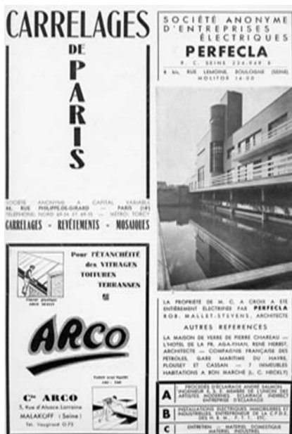
Publicité Perfecta dans l'Architecture d'aujourd'hui n°2, mars 1933.

présentées reflètent le relatif éclectisme de la revue qui produit à l'occasion un modeste catalogue constitué de la liste des architectes et de leurs réalisations. Sous le nom des architectes, des photographies et quelques maquettes sont rassemblées dans l'espace de la galerie Vignon. Trois photographies de la villa 30 sur les quatre représentant le travail de Robert Mallet-Stevens sont exposées face à la maquette de la maison de verre de Pierre Chareau. L'inauguration de l'exposition par le ministre de l'Éducation nationale 31 suscite de nombreux commentaires dont certains évoquent les œuvres présentées mais aussi le climat de raréfaction de la commande : "Derrière les deux chefs de file (Le Corbusier et Perret), s'avance pourtant, déjà plus tempéré, M. Roux-Spitz, qui construit en ce moment l'immense hôtel central des chèques postaux, et la bibliothèque de Versailles. Le charmant et aristocrate