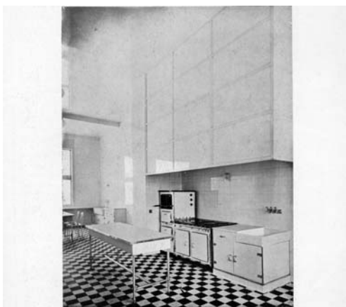
LA CUISINE DE LA MAISON DE M. C. A CROIX. MALLET-STEVENS, ARCH.