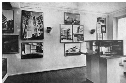
L'Architecture d'Aujourd'hui n°1, de janvier-février 1933, p. 102, vue de l'exposition Architecture française présentée à la galerie Vignon à Paris du 11 au 23 février 1933.

20- C'est le cas notamment dans L'Architecture d'Aujourd'hui n°4 de mai 1933 et dans le n°5 de juin 1933 dans lequel un article intitulé "La cuisine, une organisation d'étude et de réalisation au service de l'architecte" est en fait une publicité pour les établissements Charles Blanc illustrée de la photographie de la cuisine de la villa C. Cette image a été choisie assez curieusement pour illustrer un catalogue d'exposition intitulé Les premières fois qui ont inventé Paris , sous la direction de Philippe Simon, Pavillon de l'Arsenal, Picard, Paris, 1999, p. 85.