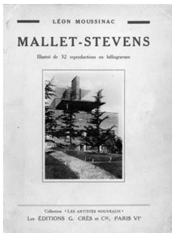
La villa C en couverture de l'ouvrage de Léon Moussinac, Mallet-Stevens, G. Grès et Cie, collection "Les artistes nouveaux", Paris, 1931.