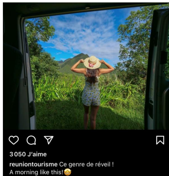
Image 1 : Publication n°42 du corpus constitué à partir du compte Instagram de l'IRT

De prime abord, nous pouvons constater que les images mettant en scène des individus sont minoritaires. En effet, sur cent publications, seulement vingt-sept mettent en scène des touristes ou la population locale. Autre particularité intéressante : aucun visage n'est clairement apparent sur ces images. Ces photographies livrent donc plusieurs messages ou plutôt, comme le dit Roland Barthes, « une série de signes discontinus » (1964 : 41). Afin d'être plus précise, nous allons illustrer notre propos avec le cliché suivant :