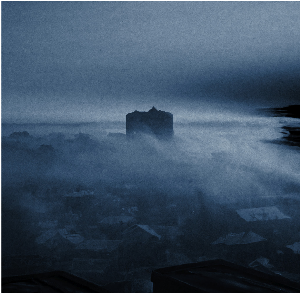
Séries « Ceci n'est pas » © Claire Chatelet

ligne Andreas Ervik, ces outils révèlent toute une grammaire de remédiation implicite et idéologique de l'imaginaire culturel 25 . Ils peuvent également être appréhendés, suivant Lukas R.A Wilde, comme « une forme de médiation au sens communicationnel-sémiotique, matériel-technique, social-institutionnel » 26 . Ils traduisent dans tous les cas un phénomène remar-