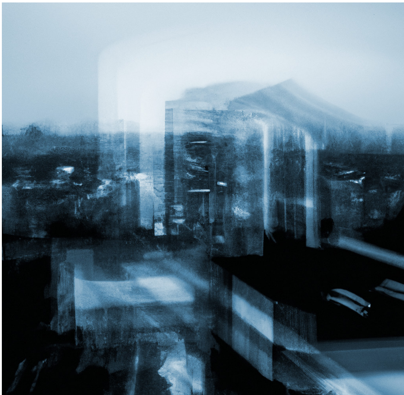
Séries « Spectres » © Claire Chatelet