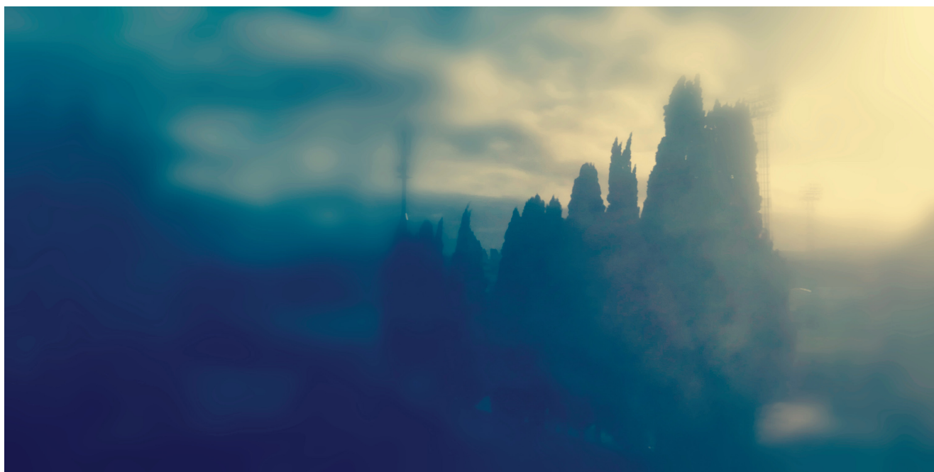
Séries « Insomnia Spaces » et « Nuits »