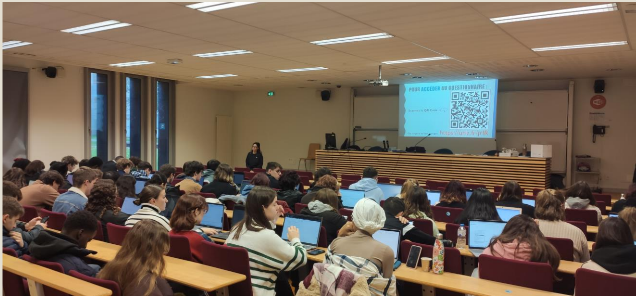
Fig. 1 - Passation du questionnaire auprès du DU PAREO (MRGT)

Population enquêtée : étudiant-es inscrit-es en Premier Cycle (Licence générale, LP, DUT/BUT, PluriPASS, etc.)