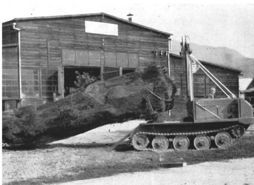
Photo 1 | Tracteur forestier demi porteur à chenilles souples « Motormuli »

La création du Fonds forestier national (FFN) en 1946 a pour objectif d'enrésiner 800 000 ha de taillis et de reconstituer 700 000 ha de peuplements détruits ou en mauvais état sanitaire (Dodane, 2009). Cela suppose souvent la coupe rase des peuplements existants. Pour mener ces transformations, les techniques sylvicoles sont modernisées et standardisées. Comme en agriculture, certaines innovations issues des technologies militaires — chimie de synthèse, chenille mécanique — sont adoptées. Anecdotes au départ, elles s'imposent peu à peu. L'inspecteur des Eaux et Forêts Demorlaine (1920) loue ainsi l'usage des chars pour préparer la régénération naturelle des Hêtres et la vidange des bois en forêt de Compiègne : « il [le char] crée un véritable sillon ameubli, grâce aux dentelures de sa chenille. Il fait donc l'office d'une charrue forestière parfaite. Il pratique rapidement un travail de « crochetage » sur un sol endurci et tassé ». Ces technologies, dont la rapidité et la brutalité étaient considérées comme des qualités dans le domaine militaire, sont désormais transférées dans le domaine civil. Elles s'y installent durablement à l'image des chenilles conçues pour les tanks et qui équipent peu à peu les tracteurs forestiers (photo 1, ci-dessous). L'adoption de ces techniques témoignent d'un rapport de plus en plus désinhibé des tenants du progrès vis-à-vis de la technologie (Bonneuil & Fressoz, 2013).