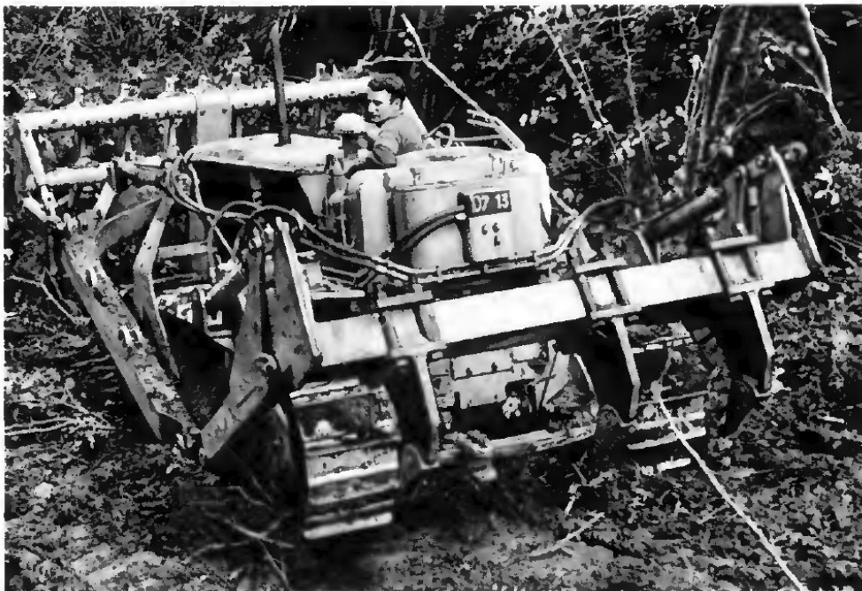
Photo 2 | Tracteur à chenilles équipés d'un rateau débroussaillieur et d'un ripper à trois dents