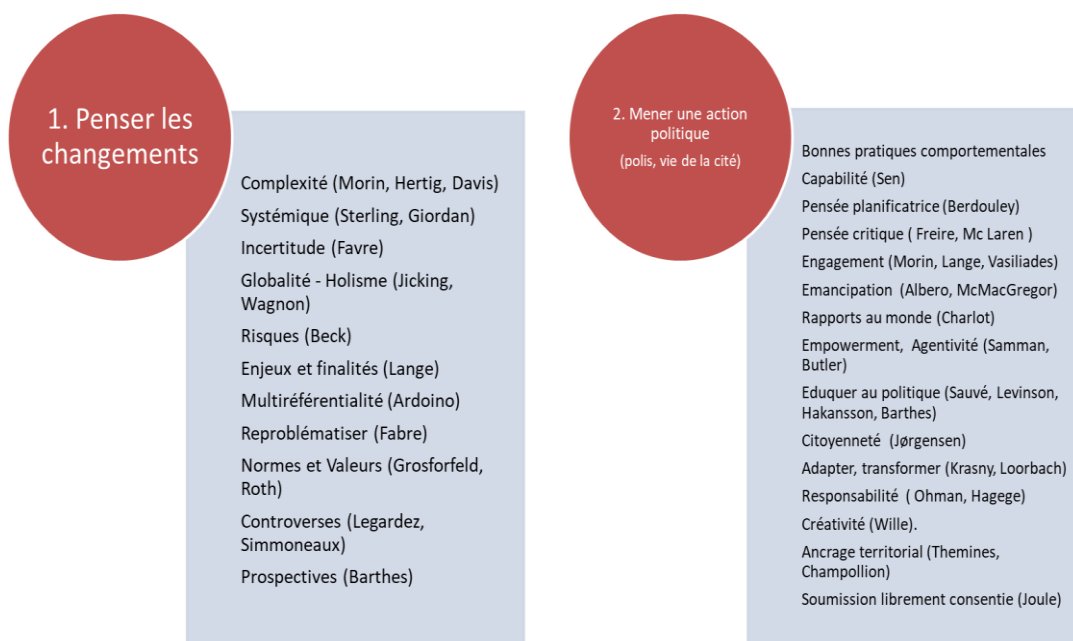
Figure 1 : Rupture épistémologique et vocabulaire des « éducations à »

La prise en charge des enjeux de l'actualité par l'éducation remet fondamentalement en cause les modèles éducatifs cumulatifs verticaux d'empilement des savoirs pour 1) penser les changements ; 2) mener une action. Cela s'accompagne d'un nouveau vocabulaire (fig. 1) (Barthes, 2023).