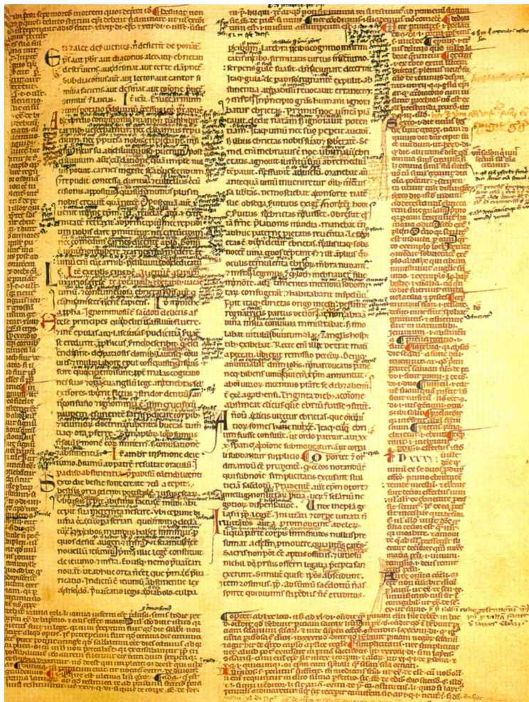
Figure 1. Une page de manuscrit : le texte, sa glose, les notes et les notes ou annotations

Décret de Gratien, vers 1140, Amiens, Bibliothèque municipale, manuscrit 354, f° 31