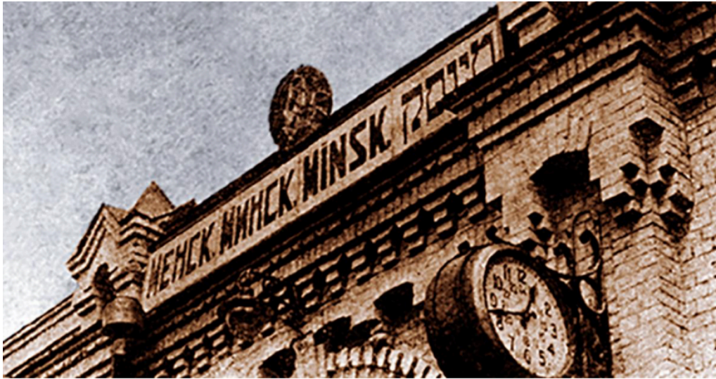
Gare de Minsk photographiée en 1926

comprendre son histoire, celle d'un creuset de « nationalités » et qu'il doit en garder la trace. Au Bélarus, et en particulier dans sa capitale Minsk, la présence juive est partout et nulle part. Elle n'est visible que pour ceux qui savent la voir. Nous sommes loin désormais de cette ville dont la gare affichait naguère fièrement son nom en russe, bélarusse, polonais et yiddish.