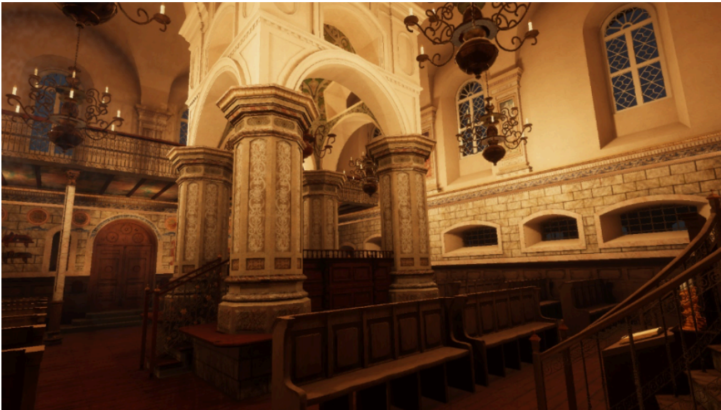
Intérieur de la synagogue de Slonim reconstitué sur la plateforme de réalité virtuelle.

Ce projet virtuel s'accompagne d'une réflexion sur la redéfinition de la conception classique du musée comme espace de conservation de collections. Mais, dans notre cas précis, nous n'avons de toute façon pas d'autres choix que de le redéfinir. C'est pour que cela qu'en ce moment nous créons ce musée en ligne participatif qui pourra faire des liens avec les différentes collections dans le monde.