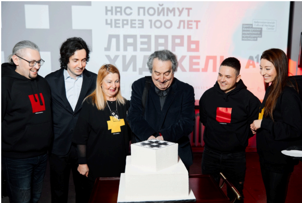
Inauguration de l'exposition consacrée à Lazar Khidekel.

le remettre aux gagnants. C'était un geste très inspirant pour la jeune génération de Bélarusses. Lorsque nous sommes allés à l'Union des architectes, ils avaient les larmes aux yeux et nous ont dit : voilà ce qui peut être l'identité visuelle du Bélarus. Car l'architecture de Khidekel est absolument révolutionnaire, même pour nous aujourd'hui. Or, cet homme et ces idées ont vu le jour à Vitebsk. La mission que nous sommes donnés à travers tous ces projets est la même : montrer notre passé de manière à nourrir l'avenir. C'est pour ça que nous faisons appel à de nouvelles personnes, de jeunes et talentueux artistes qui vivent au Bélarus.