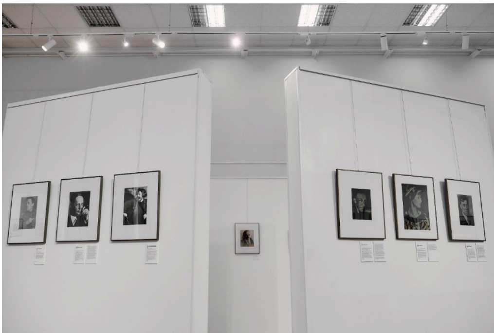
Vue de l'exposition consacrée à l'œuvre de Moïseï Nappelbaum, « Le portrait d'une époque » à Minsk – BJCH.