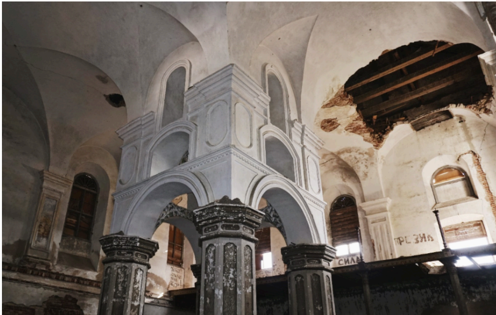
Intérieur de la synagogue de Slonim en l'état - BJCH.

Surtout, c'est un projet qui, lorsque nous l'avons présenté l'année dernière, a rencontré beaucoup de succès parmi les jeunes. Pourtant, il est assez difficile de rendre une synagogue attractive pour les jeunes ! Désormais, nous envisageons de multiplier l'expérience en recréant d'autres synagogues au Bélarus, qui refléteront également la diversité architecturale du monde du shtetl , car elles sont toutes de styles complètement différents. Au musée d'art et d'histoire du Judaïsme (mahJ) à Paris, il existe par exemple une maquette en bois de la synagogue de Volpe et nous allons créer ensemble une reconstruction de la synagogue de Volpe en réalité virtuelle, qui pourrait être présentée à la fois dans les musées et sur notre plateforme en ligne.