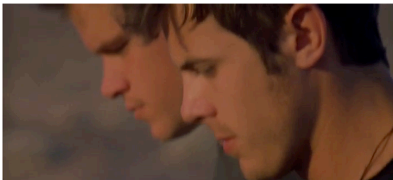
Illustration 1 : photogramme tiré de Gerry (Gus Van Sant, 2002)

En guise de vérification, je voudrais prendre exemple d'un plan « prolongé » qui peut à mon sens donner à expérimenter cet effet de désaccord, pour peu que l'on soit engagé dans le transport. Il s'agit d'un très long plan dans Gerry de Gus Van Sant (2002) inspiré d'un plan issu du cinéma de Belà Tarr où les deux personnages marchent de concert dans le désert. Nous voyons en plan rapproché leurs deux visages en mouvement et entendons le bruit de leurs pas sur un sol de gravillons. Si le spectateur « lâche prise » (et le film y conduit dans la mesure où l'enjeu narratif du plan, bien vite, s'exténue), le plan pourra induire un « accordage sensoriel » dans l'effet d'un calage rythmique entre les mouvements des têtes vues de profil et les bruits de pas. Or, en certains moments, il se produit (dans mon expérience du moins, je ne crois pas qu'elle soit solitaire) des effets de déphasage entre le rythme de balancement des visages et la cadence des bruits de pas (illustrations 1 et 2). L'effet est toujours de courte durée, mais assez net me semble-t-il pour rendre l'effet du transport quelque peu conscient dans son éclipse même.