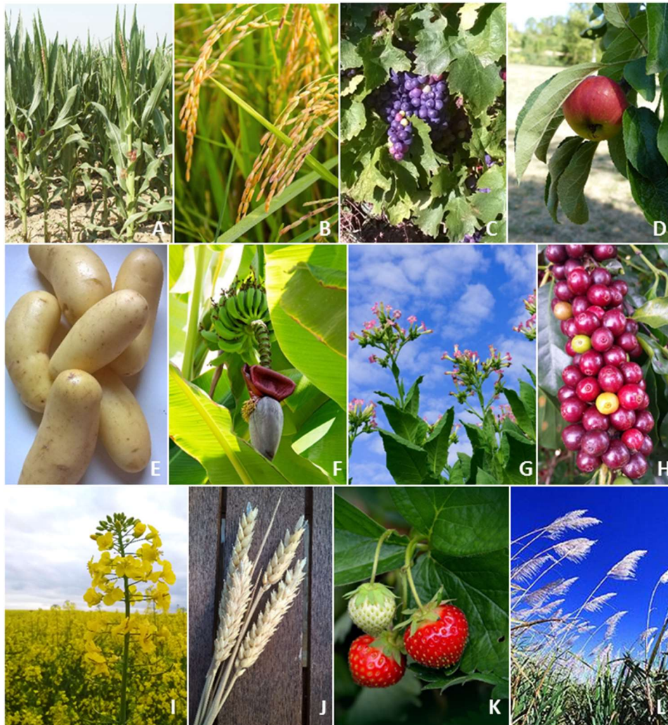
Figure 2 : De nombreuses plantes cultivées ont été marquées par des événements de polyplôidie. On distingue des espèces paléopolyploïdes, aujourd'hui diploïdes, pour lesquelles l'événement de polyplôidie est très ancien ; c'est le cas par exemple du maïs (A), du riz (B), de la vigne (C), du pommier (D). De nombreuses autres espèces cultivées présentent toujours les différentes copies de génome issues d'événements plus ou moins récents de polyplôidie. Ces événements ont eu lieu au sein d'une même espèce, comme pour la pomme de terre (4x, E), ou ont le plus souvent impliqué un événement d'hybridation interspécifique ; pour illustration, on peut noter le cas du bananier (3x, F), du tabac (4x, G), du caféier (4x, H), du colza (4x, I), du blé tendre (6x, J), du fraisier (8x, K), de la canne à sucre (8x, L). Les indications 3x, 4x, 6x, 8x correspondent aux niveaux de ploïdie des espèces : tri-, tétra-, hexa-, octoploïdie.

élevé et des graines ou des tubercules plus gros ait favorisé la sélection des premières formes polyploïdes.