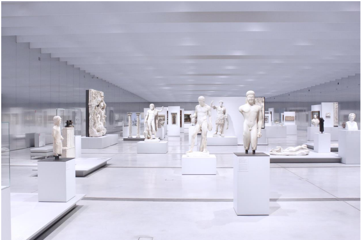
Figure 10 : Le Louvre de Lens, architecte Sanna, photo ccsearch