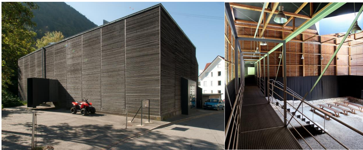
Figure 1 et 2 : Musée archéologique de Chur, architecte Peter Zumthor, photos ccsearch

la négative la notion d’anachronisme en précisant que le refus d’anachronisme chez l’historien consiste à ne surtout pas projeter nos propres réalités, nos concepts, nos goûts, nos valeurs actuelles sur les réalités du passé. Cette « concordance des temps » impossible à réaliser 1 doit laisser la place à ce qu’il appelle la « convenance des temps » et refuser le déni précédent. La perception extérieure du musée, avec les matériaux utilisés, fait songer à une ancienne photo « noir et blanc » qui place, entre les ruines antiques et la ville actuelle, une temporalité intermédiaire qui est l’autrefois local et le souvenir de famille. L’allure générale de la construction qui s’apparente à celle des anciennes granges de séchage du tabac locales s’inscrit dans la même temporalité (Figure 1).