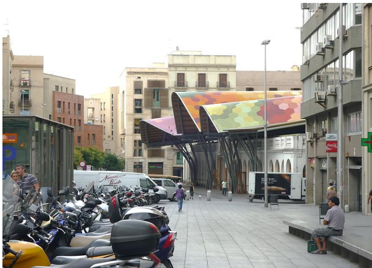
Figure 8 : Marché Sainte Catherine de Barcelone, architecte Enric Miralles, photo Christian Drevet

Enric Miralles préconise un regard distrait, aléatoire, chanceux, vis-à-vis du contexte et du programme nous rapprochant d'une lecture synchrétique ouvrant le champ des possibles au-delà des limites culturelles.