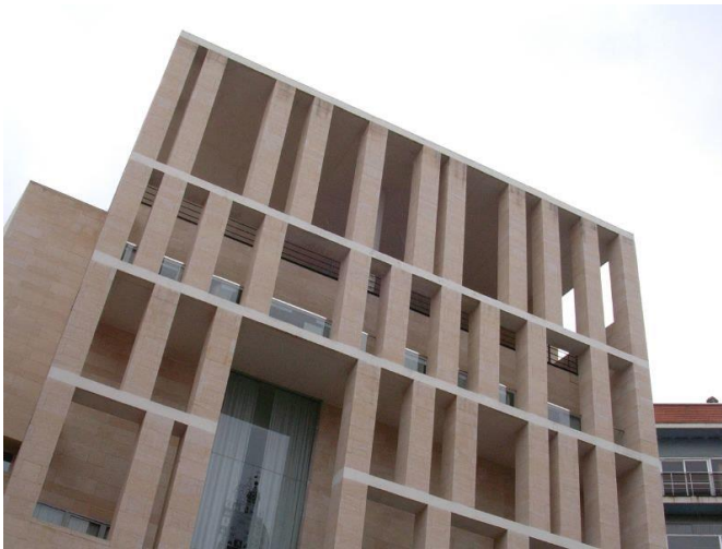
Figure 6 : Hôtel de Ville de Murcie, architecte Rafaël Moneo, photo ccsearch

L'architecte espagnol Rafael Monéo a construit en 1998 l'extension de l'Hôtel de Ville de Murcie. La façade sur la place Ortego présente un anachronisme multiple et ambigu, entre une excavation troglodyte montrant une décantation géologique, un théâtre romain mettant en scène le jeu social, une construction moderne emblématique qui est la « Casa Del Fascio » 1 (Figure 6). Cette façade arrière de l'Hôtel de Ville de Murcie évoque aussi un retable d'autel catholique du moyen âge en écho à la cathédrale située juste en face.