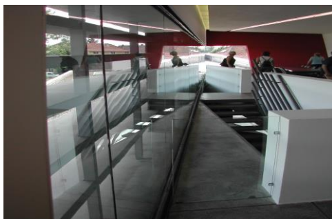
Figure 5 : Station de pompiers de Vitra, architecte Zaha Hadid

C'était sans doute l'architecture moderne qui s'était le plus investie dans un futur idéal en produisant une sorte d'anachronisme inversé, proche de l'utopie que l'on a qualifié de futurisme , mouvement littéraire et artistique qui rejette l'esthétique classique pour célébrer le monde moderne. C'est peut-être le peintre Marcel Duchamp, avec notamment son œuvre intitulée Nu descendant un escalier , et aussi le travail photographique de Jules Marey, qui incarnent le mieux la fascination du futurisme pour l'expression du mouvement. L'architecture contemporaine continue à faire vivre l'esprit futuriste, en délaissant toutefois la représentation de la performance et du progrès, chère aux futuristes, pour s'infléchir vers la sensation phénoménologique du mouvement. C'est, par exemple, le cas de la station de pompiers à Vitra, construite par l'architecte irakienne Zaha Hadid. Son bâtiment consiste en une série de murs écrans scandés et étirés le long de la rue centrale de l'usine et dont le programme occupe les entre-deux. Elle crée là une première traduction architecturale de l'espace-mouvement 1 , généré par les mouvements qui le traversent et non les parois qui le délimitent.