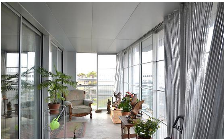
Figure 7 : Tour du Bois Le Prêtre, architectes Anne Lacaton et Jean Phillippe Vassal

Le lien entre les fragments de la vie quotidienne, c'est l'air, la lumière, le mouvement des corps. Les protagonistes, c'est les usagers et leurs objets matériels familiers. Le plateau, c'est l'architecture, c'est-à-dire le travail des architectes.