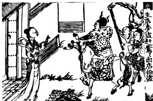
图3 1498年版本中的梦境 ②

“阳具化”的莺莺独自面对匪盗，并且梦者张生完全没有出现在画面上。将两幅图合起来看则更能彰显金圣叹评点的意义——这与L图式机制推演所得结论是相容的：某日，张生站在了杜确的位置上，成为女人欲望的对象与口中的“英雄”。金的改写与阐释使得王实甫所绘的梦境在无意识中显现出了内涵。对之理解恰恰可以用金圣叹评点《西厢记》中颇具见地的那句话来说明（位于其言退匪盗和张生梦醒之间）：“是张生此时极其不得意梦，是张生多时极得意事。” [12] 某种意义上，如果这对现代的、“分裂的”主体有什么启示的话，那就是激发他/她欲望的最终对象绝不是现实中任何实际之人可充当的。张生占据了自我的位置（图式中的“a”），满足了自己的幻想。为了维系幻想，大他者（女人）的身份须被维持（但无法接触）。匪盗不仅是欲望的象征，也以压力、恐惧的人格化形式出现，并以这种性质发挥出了隐喻的功能：他们是可怕的，正如欲望对象被夺走那一刻是可怕的一样，这是欲望必然的结果。这一过程中，主体可能到最后会感到不悦，但他/她还是满足了幻想。