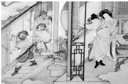
图2 金圣叹版本中的梦境 ①