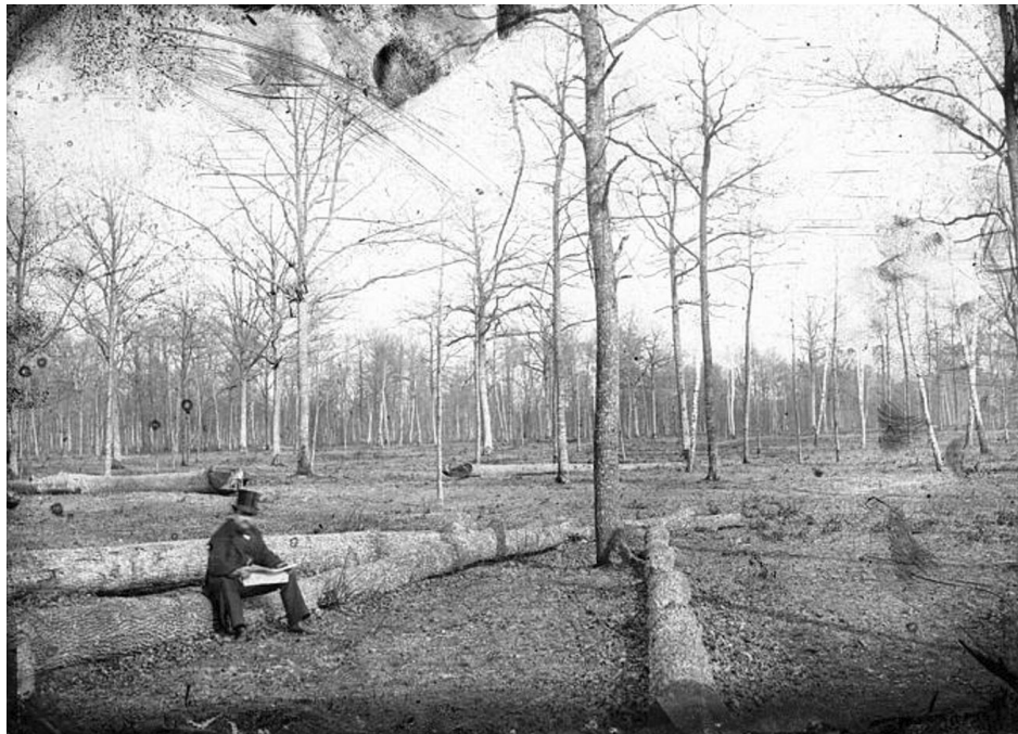
Photo 3 | Coupe de bois à Nesles-la-Vallée ou Montgeron, vers 1900