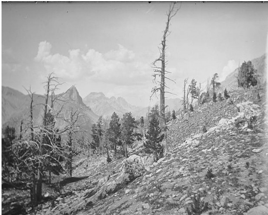
Photo 1 | Défrichement en forêt sur le site des rochers de Barabas - rochers des rois mages, vers Briançon Serre-Chevalier Montgenèvre

Photo © Paul Larceron, 1898, source Plateforme ouverte du patrimoine, ministère de la Culture