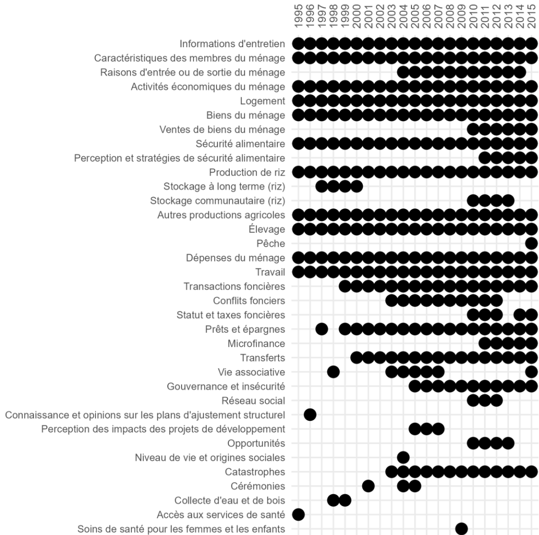
143 Figure 2 : Principaux modules inclus dans les questionnaires des OR chaque année (Source : 144 auteurs). Le graphique illustre la présence des modules d'enquête au fil des années de 1995 à 145 2015 : chaque point noir représente l'inclusion d'un module spécifique dans l'enquête pour 146 cette année, tandis que l'absence de point indique que le module n'a pas été inclus. 147

134 La méthodologie des OR combinait des méthodes quantitatives pour décrire les situations et 135 une perspective qualitative pour les expliquer, offrant ainsi une vue d'ensemble complète des 136 dynamiques rurales. En plus du questionnaire ménager, une enquête communautaire a été 137 menée, impliquant des observations sur le terrain et des entretiens semi-structurés. Cette 138 approche mixte produisait des informations générales sur la région et fournissait des 139 perspectives structurelles et situationnelles sur divers aspects de la vie communautaire 140 (campagnes agricoles, environnement social et culturel, santé, éducation, sécurité, soutien au 141 développement et tarification des produits). 142