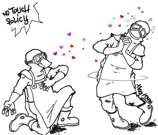
Ejemplo 2: Caricatura del dibujante Brax sobre la no touch policy