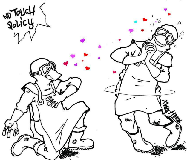
Ejemplo 2: Caricatura del dibujante Brax sobre la no touch policy