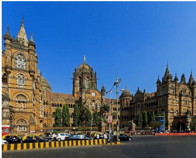
Figure 10.1. La gare Chhatrapati-Shivaji à Mumbai

lieux-symboles. C'est le cas par exemple de la gare Chhatrapati-Shivaji à Mumbai, inscrite sur la liste du patrimoine mondial de l'UNESCO depuis 2004 et fruit d'un double héritage, colonial d'un côté et postcolonial, national de l'autre. Le nom même du lieu de transport illustre cette volonté de dépassement de la logique de domination impériale britannique, adopté en 1996 en lieu et place de son appellation de terminus Victoria, en référence à la souveraine. Chhatrapati Shivaji est en effet le fondateur de l'Empire marathe, qui a donné son nom à l'État d'ancrage de la gare, le Maharashtra. Parmi les critères retenus pour justifier le classement, les experts ont principalement mentionné les qualités architecturales de la gare, présentée comme un « remarquable exemple d'architecture néogothique victorienne en Inde » (UNESCO 2004), ce qui a contribué à en faire un symbole de la métropole de Mumbai, considérée comme la « ville gothique et le plus important port marchand d'Inde » (UNESCO 2004). Mais certains éléments tels que le dôme de pierre et les tourelles rappellent également l'architecture traditionnelle des palais indiens (figure 10.1).