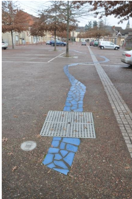
Figure 10.3. Un exemple de référence à la route nationale 7 : la fresque au sol représentant le tracé de la route de Paris à Menton (Lapalisse, Allier)

tracé de la route de Paris à Menton. Elle met ainsi en scène le caractère historique de l'infrastructure.