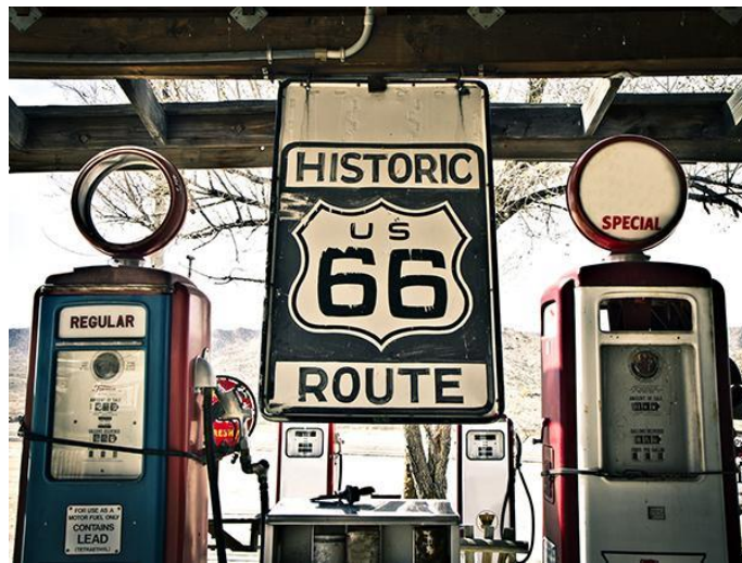
Figure 10.2. Un exemple de valorisation patrimoniale de la route 66

de la mémoire » le long de la route 66. Ils analysent la manière dont sont présentés aux touristes les divers « thèmes patrimoniaux » et soulignent le caractère sélectif de cette présentation, qui porte sur la vie quotidienne des individus et des communautés le long de la route depuis les années 1930, sur le travail en bord de route ou encore sur l'ancien tronçon de la route.