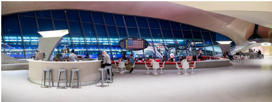
Figure 10.5. Une vue du TWA Hotel à l'aéroport John-F.-Kennedy de New York

exposer ponctuellement des œuvres d'art anciennes, que l'on pense à la petite annexe du Rijksmuseum, présente depuis 2002 à l'aéroport Amsterdam-Schiphol, qui a été l'initiateur de ces espaces, ou à la galerie du satellite M de Roissy-Charles-de-Gaulle, depuis 2013, toutes deux à proximité des boutiques. Ces formes de patrimonialisation aéroportuaire, comme dans d'autres lieux de transport, participent aussi d'objectifs marchands. Elles sont en effet étroitement associées à une expérience de consommation, liées aux activités commerciales de l'aérogare et à l'attractivité de l'aéroport pour les passagers en correspondance, qui pourraient être tentés d'opter pour un autre hub .