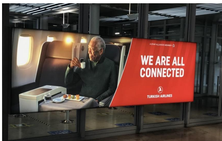
Figure 9.1. « Nous sommes tous connectés » : à qui s'adresse le « nous » de cette publicité d'une compagnie aérienne à l'aéroport de Nuremberg ?