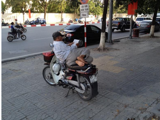
Figure 9.2. Chauffeur de moto à Hanoi (xe ôm). Les mesures édictées limitent désormais les espaces d'attente autorisés, pour marginaliser l'activité 6

Le caractère spatialement sélectif d'actions déployées dans certains lieux et territoires au détriment des autres constitue une deuxième forme d'injustice. Elle prend tout spécialement sens dans le cadre d'une dualisation des transports entre les centres urbains, particulièrement visibles, où s'affirment les alternatives à la voiture individuelle, et les périphéries, où la domination automobile prévaut, comme l'observent Andrés Felipe Valderrama Pineda et Nina Vogel (2014) à propos de Copenhague depuis les années 1990. Les opérations de piétonnisation des rues des centres, souvent motivées par des objectifs d'attractivité économique (commerciale, voire touristique), peuvent conduire à reporter et à renforcer le trafic automobile au-delà des quartiers concernés. Le risque est alors d'y concentrer les nuisances associées, qu'il s'agisse du trafic de transit ou de celui généré par la fréquentation accrue des centres qui en résulte. Combinées à l'essor des parkings payants de courte durée à proximité des centres et d'infrastructures routières en périphérie (rochades notamment), certaines réalisations ne vont pas de soi du point de vue de leur durabilité sociale, voire environnementale (Brenac et al. 2013 ; Reigner et