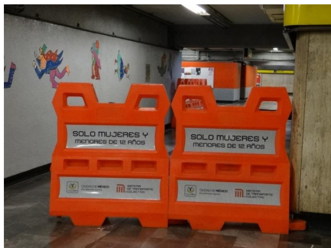
Figure 9.4. Barrière limitant l'accès d'une partie du quai de métro aux femmes et aux enfants de moins de 12 ans, à Mexico

Les concepteurs tendent en effet à considérer que ce nouvel espace qu'est le métro a vocation à changer le comportement des individus, à les rendre plus respectueux de la morale publique, le harcèlement sexuel étant de ce point de vue répréhensible. Les militantes féministes du Caire se concentrent sur d'autres combats, du moins jusqu'au début des années 1990. Celles-ci constituent un tournant en faveur de la lutte contre le harcèlement sexuel. Sa mise sur l'agenda public s'effectue dans le cadre plus large de la question des droits humains et des droits des femmes à l'échelle mondiale, par les organisations internationales. Elle pourrait bien, avec l'agression sexuelle d'une jeune femme montant dans un bus en pleine journée, place Attaba en 1992, dans le centre, fortement médiatisée, avoir conforté la politique de voitures isolées dans le métro. Face aux motivations et aux questions multiples que ce type de séparation met en jeu, Marion Tillous (2017) pointe la convergence de la position de deux associations féministes contemporaines, Bassma et ShoftTa7rosh : le « wagon des femmes n'est pas une solution, et s'il n'existait pas il ne faudrait pas l'introduire. Mais dans la mesure où il existe, il est considéré comme un levier d'action contre les harceleurs et un moyen de se soustraire au risque de harcèlement faute de mieux. » On saisit ici tout à la fois la spécificité et le caractère multiforme de ces séparations liées au genre dans les lieux de transport.