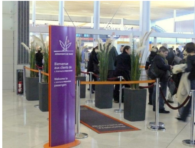
Figure 9.3. Accès coupe-file à l'aéroport Paris-Charles-de-Gaulle