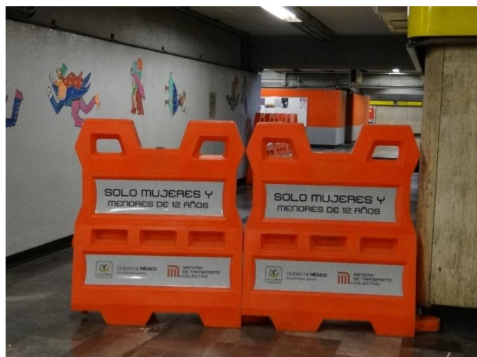
Figure 9.4. Barrière limitant l'accès d'une partie du quai de métro aux femmes et aux enfants de moins de 12 ans, à Mexico

Les concepteurs tendent en effet à considérer que ce nouvel espace qu'est le métro a vocation à changer le comportement des individus, à les rendre plus respectueux de la morale publique, le harcèlement sexuel étant de ce point de vue répréhensible. Les militantes féministes du Caire se concentrent sur d'autres combats, du moins jusqu'au début des années 1990. Celles-ci constituent un tournant en faveur de la lutte contre le harcèlement sexuel. Sa mise sur l'agenda public s'effectue dans le cadre plus large de la question des droits humains et des droits des femmes à l'échelle mondiale, par les organisations internationales. Elle pourrait bien, avec l'agression sexuelle d'une jeune femme montant dans un bus en pleine journée, place Attaba en 1992, dans le centre, fortement médiatisée, avoir conforté la politique de voitures isolées dans le métro. Face aux motivations et aux questions multiples que ce type de séparation met en jeu, Marion Tillous (2017) pointe la convergence de la position de deux associations féministes contemporaines, Bassma et ShoftTa7rosh : le « wagon des femmes n'est pas une solution, et s'il n'existait pas il ne faudrait pas l'introduire. Mais dans la mesure où il existe, il est considéré comme un levier d'action contre les harceleurs et un moyen de se soustraire au risque de harcèlement faute de mieux. » On saisit ici tout à la fois la spécificité et le caractère multiforme de ces séparations liées au genre dans les lieux de transport.