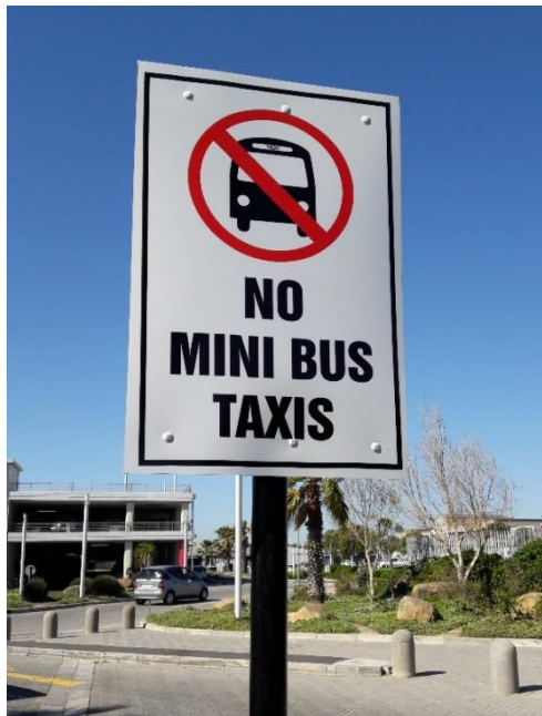
Figure 8.4. À proximité du shopping mall de Bayside (au Cap), les restrictions d'accès pour les minibus-taxis

à construire des enclaves hermétiques aux services, aux logiques de territorialisation et aux normes du transport artisanal.