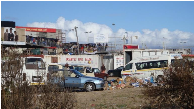
Figure 8.3. De l'autre côté du shopping mall d'Ekuphumleni : la gare de minibus occupée par les exploitants

Enfin, il est également important de mentionner que dans d'autres shopping malls , l'accès aux minibus n'est pas toléré (figure 8.4). Dans ce cas, ce sont les externalités négatives du transport artisanal qui sont ciblées (bruit, pollution, possible congestion), mais également l'image de ce mode de transport, qui n'est pas conforme aux standards et au modèle d'un shopping mall moderne, accueillant et propre. Là où les autorités locales peinent parfois à imposer leurs règles, les acteurs économiques n'hésitent pas