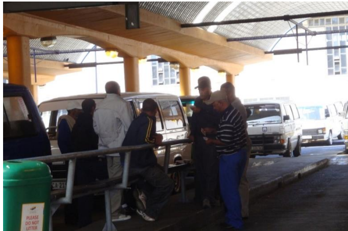
Figure 8.1. Les conducteurs jouent aux cartes pendant les heures creuses dans la gare de minibus de Station Deck, au Cap

les pôles récepteurs. Par ailleurs, l'intensité de ces mouvements pendulaires s'observe également à travers la répartition entre heures de pointe et heures creuses. Les heures de pointe commencent généralement à l'aube et, pendant plusieurs heures, les gares sont saturées, tout comme en fin d'après-midi et jusqu'au début de la soirée. À ces heures de surfréquentation des lieux de transport, pendant lesquelles les opérateurs ne font pas ou peu de pauses, succèdent des heures où les gares deviennent des lieux de détente pour les conducteurs, qui passent le temps en jouant, dormant ou discutant (figure 8.1). Les fortes fluctuations qui existent entre heures creuses et heures de pointe aboutissent même dans certains cas à la disparition des gares une fois l'heure de pointe terminée, comme à Abidjan (Kassi-Djodjo 2015).