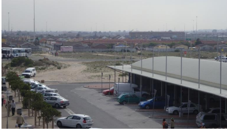
Figure 8.2. La gare de minibus rénovée du shopping mall d'Ekuphumleni à Khayelitsha, au Cap