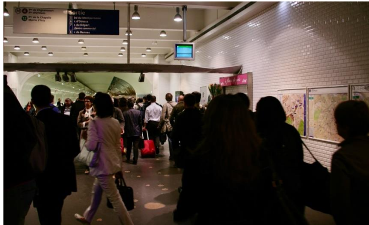
Figure 7.1. Foule compacte et agitation à Montparnasse-Bienvenue à l'heure de pointe (source : Damien Masson (2011))