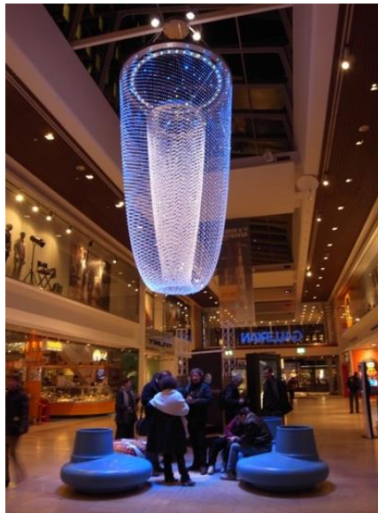
Figure 7.3. Une installation sonore et lumineuse qui irradie l'espace de sa présence dans un centre commercial de Stockholm

Dans les espaces fermés, la tâche d'asservissement des paramètres sensibles de l'environnement matériel est facilitée. Centres commerciaux, restaurants, hôpitaux, musées, etc. font l'objet de mises en forme sensibles, voire de mises en scène, comme l'atteste la figure 7.3, par une action sur la composition, les matériaux, les couleurs, la luminosité, la température, ainsi que sur les dimensions sonores, olfactives, voire tactiles et podotactiles.