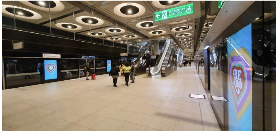
Figure 7.5. Forte luminosité, contraste entre clarté à quai et obscurité sur les voies et campagne d'affichage « Be kind » incitant les passagers à plus de civisme à la station Paddington (Elizabeth line, Londres), ouverte au public en 2022

de création de sentiment de sécurité et de quête de limitation de la délinquance par l'aménagement, ou prévention situationnelle 11 .