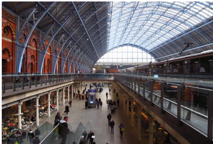
Figure 7.2. La grandiloquence de l'architecture de la gare de Londres Saint-Pancras, tout en volumes, modénatures et ornements

On peut être tenté d'affirmer qu'à chaque technique de transport correspond une ambiance, au même titre que Marc Desportes indique que « chaque grande technique de transport modèle [...] une approche originale de l'espace traversé, chaque grande technique porte en soi un "paysage" » (2005, p. 8). Les lieux de transport évoquent souvent des univers sensibles forts, qu'ils soient marqués du sceau de l'exceptionnel pour beaucoup d'utilisateurs, comme certaines grandes gares et grands aéroports, aux espaces amples, lumineux (figure 7.2), où les annonces sonores tombent des volutes, qu'ils renvoient au contraire au quotidien de l'agitation, dans les tunnels plus ou moins obscurs, propres, aux arômes composés d'effluves mécaniques, électriques et organiques des métros et trains souterrains. Pour autant, s'en tenir aux caractéristiques matérielles et sensibles des espaces pour qualifier leurs ambiances conduirait à oublier qu'elles sont le produit d'une relation avec celles et ceux qui font l'expérience de ces espaces, sujets ni neutres ni passifs.