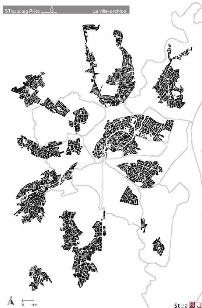
Figure 6.3. Strasbourg « ville archipel ». Zones où la part de la voirie dédiée aux piétons dépasse 30 %