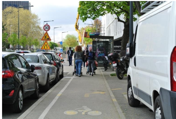
Figure 6.2. La mobilité active dans ses lieux. Maisons-Alfort (Val-de-Marne), avril 2019.

Les politiques de développement des modes actifs que nous examinons sont conçues dans un contexte de grande difficulté à étendre en superficie les lieux de circulation en général. Alors que la croissance urbaine s'accompagnait d'une multiplication d'infrastructures pour les automobilistes, les modes actifs ont semblé pouvoir se contenter de faible largeur de voirie ou de passages relativement discrets pour traverser de grandes parcelles, mais l'augmentation projetée de leur pratique oblige à revoir ce jugement.