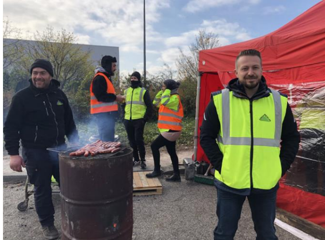
Figure 4.2. Piquet de grève à l'entrepôt de Leroy Merlin à Valence (Drôme)