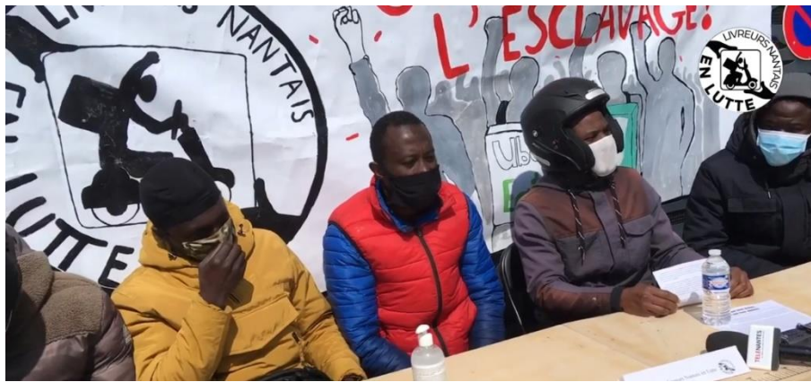
Figure 4.3. Conférence de presse du Collectif des livreurs nantais en lutte, le 15 avril 2021 14