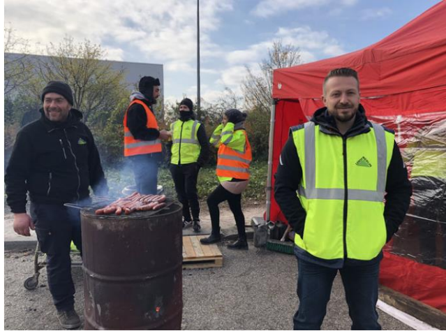
Figure 4.2. Piquet de grève à l'entrepôt de Leroy Merlin à Valence (Drôme)