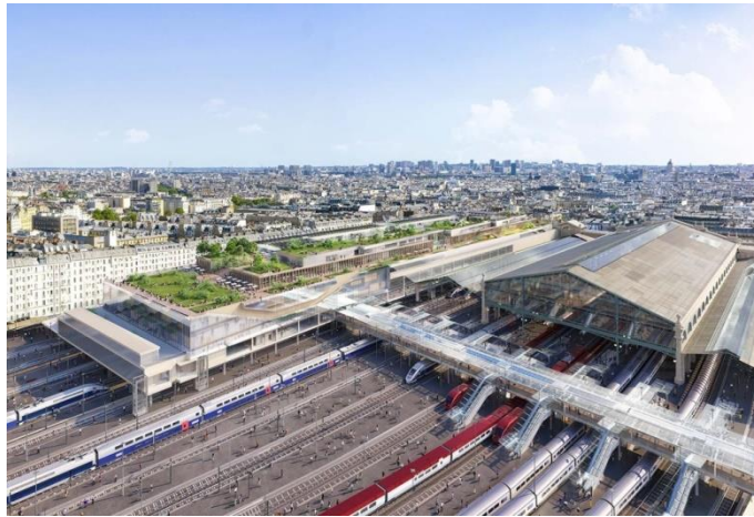
Figure 3.1. Le projet d'agrandissement de la gare du Nord (source : Valode & Pistre Architectes (2019))

& Connexions 2018). Pour Gares & Connexions, il s'agit de générer de nouvelles recettes pour financer la gare, son développement, son fonctionnement et sa gestion. Ce projet d'ampleur a fait l'objet de débats lors du dépôt du permis de construire en 2019. La mairie de Paris, qui avait initialement annoncé son soutien, l'a ensuite mis en doute début 2020 face à des riverains, des usagers, des collectifs citoyens 2 et des architectes (Collectif 2019) interrogeant l'utilité du projet, la volumétrie, la densité commerciale, la faible intégration dans le quartier et le peu de prise en compte des enjeux liés à la mobilité quotidienne. Le montage de ce projet, associant le groupe Auchan, est également dénoncé au motif d'un risque de privatisation et de marchandisation de la gare. En novembre 2020, la mairie de Paris a finalement donné son accord, sur la base d'un permis modifié à la marge, actant une réduction de la hauteur du nouveau bâtiment et des espaces commerciaux.