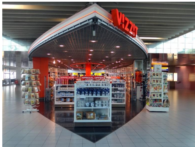
Figure 3.2. Un espace commercial implanté directement le long des flux à l'aéroport d'Amsterdam-Schiphol