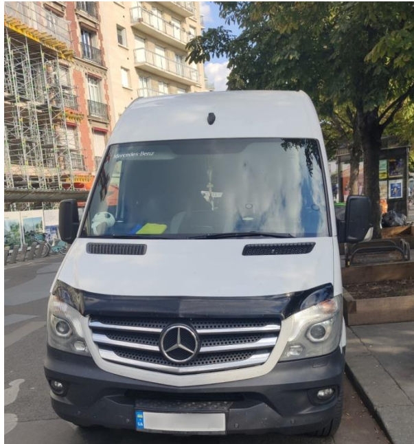
Figure I.3. Camionnette aux couleurs de l'Ukraine, à Paris

une lutte matérielle et symbolique par le bas en faveur de la souveraineté du pays (figure I.3).