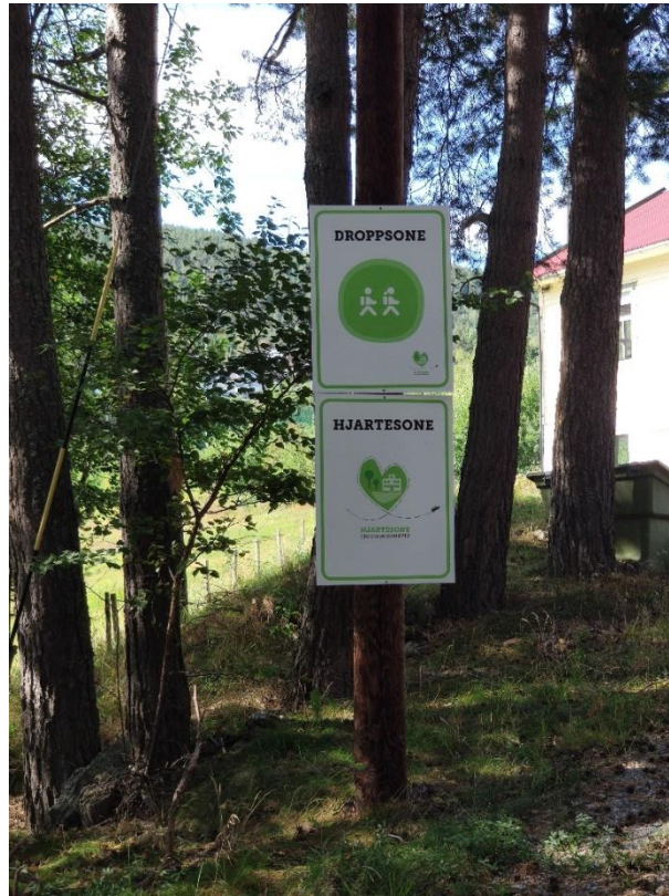
Figure I.4. À proximité de l'école du village norvégien de Kaupanger : « zone d'arrivée [des enfants à l'école] », « zone cœur »