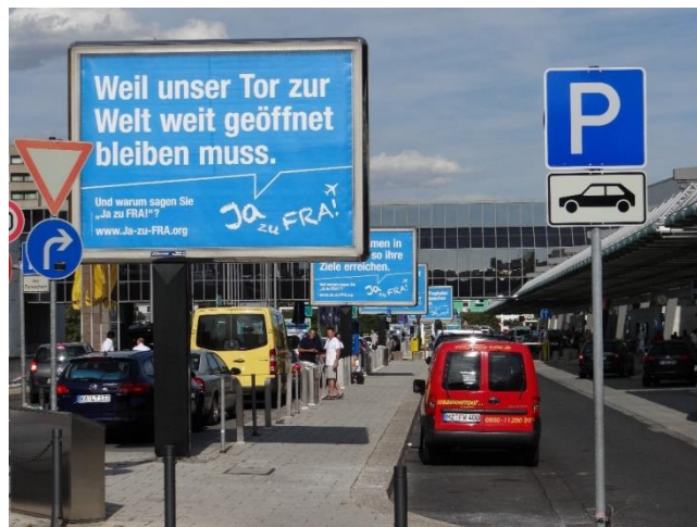
Figure I.1. « Parce que notre porte sur le monde doit rester grande ouverte. » Campagne en faveur de l'aéroport de Francfort

Le plaidoyer en faveur de l'aéroport comme porte d'entrée du territoire urbain et national vise à renforcer l'acceptabilité de son activité et de son emprise territoriale par les airs, donc en trois dimensions, en volume. Sa légitimité est en effet questionnée par un conflit environnemental ancien. Les nuisances sonores associées à ses couloirs aériens ont en effet cristallisé un conflit de longue durée avec une partie des riverains et des militants écologistes, émaillé par la mort de deux policiers, à l'occasion de la construction de la troisième piste en 1987. L'antagonisme continue à nourrir des manifestations hebdomadaires contre l'intensité du trafic au milieu des halls de départ du terminal 1 (Frétigny 2016). Des lieux de transport comme les aéroports n'ont ainsi pas attendu la montée en puissance des enjeux de dérèglement climatique pour être ciblés dans le cadre de mobilisations environnementales.