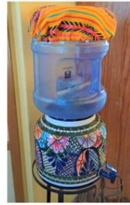
Filtre Céramique