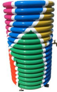
Fontaine Safe Water Cube