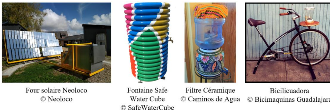
Figure 1 Les cas d'étude sélectionnés