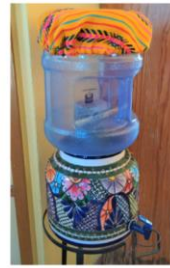
Filtre Céramique