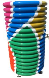
Fontaine Safe Water Cube