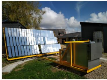
Four solaire Neoloco