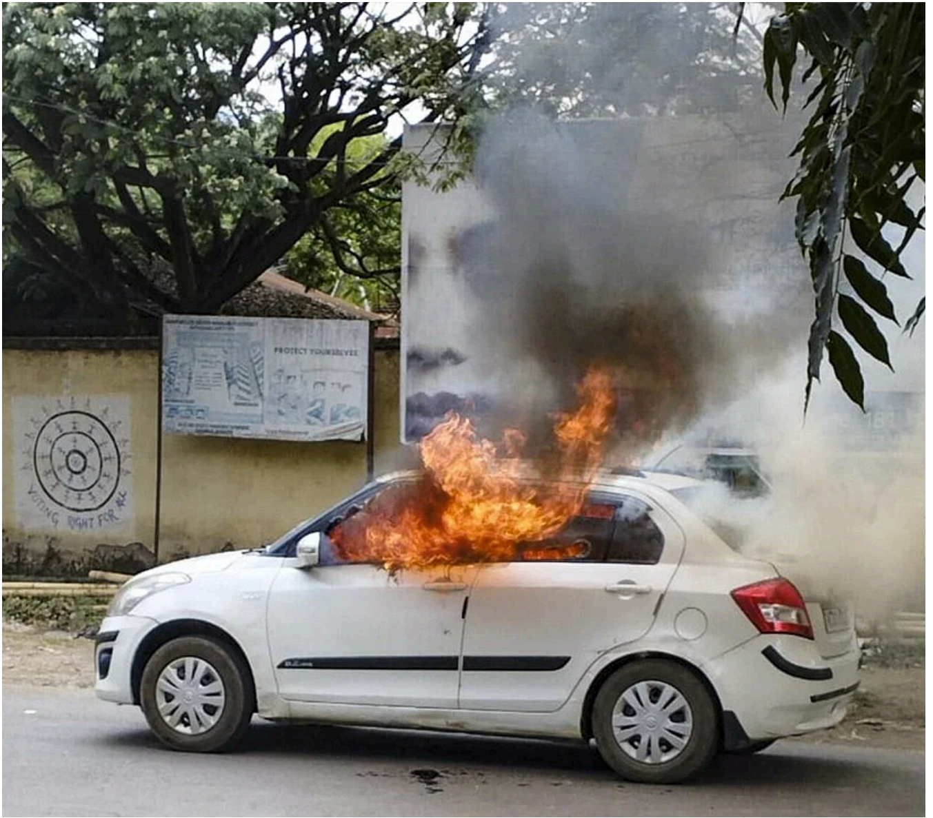
परिवार की जला दी गई कार

भीड़ ने कार चारों ओर घेर लिया था। वे गाड़ी के बोनट पर और बूट स्पेस को डंडों से पीट रहे थे। कुछ क्रोधित माइरा पाइबिस जामनौहकिम की ओर, कार की खिड़की पास आकर उनसे सवाल-जवाब कर रही थीं तथा उन्हें कार का दरवाजा खोलने और बाहर आने के लिए कह रही थीं।