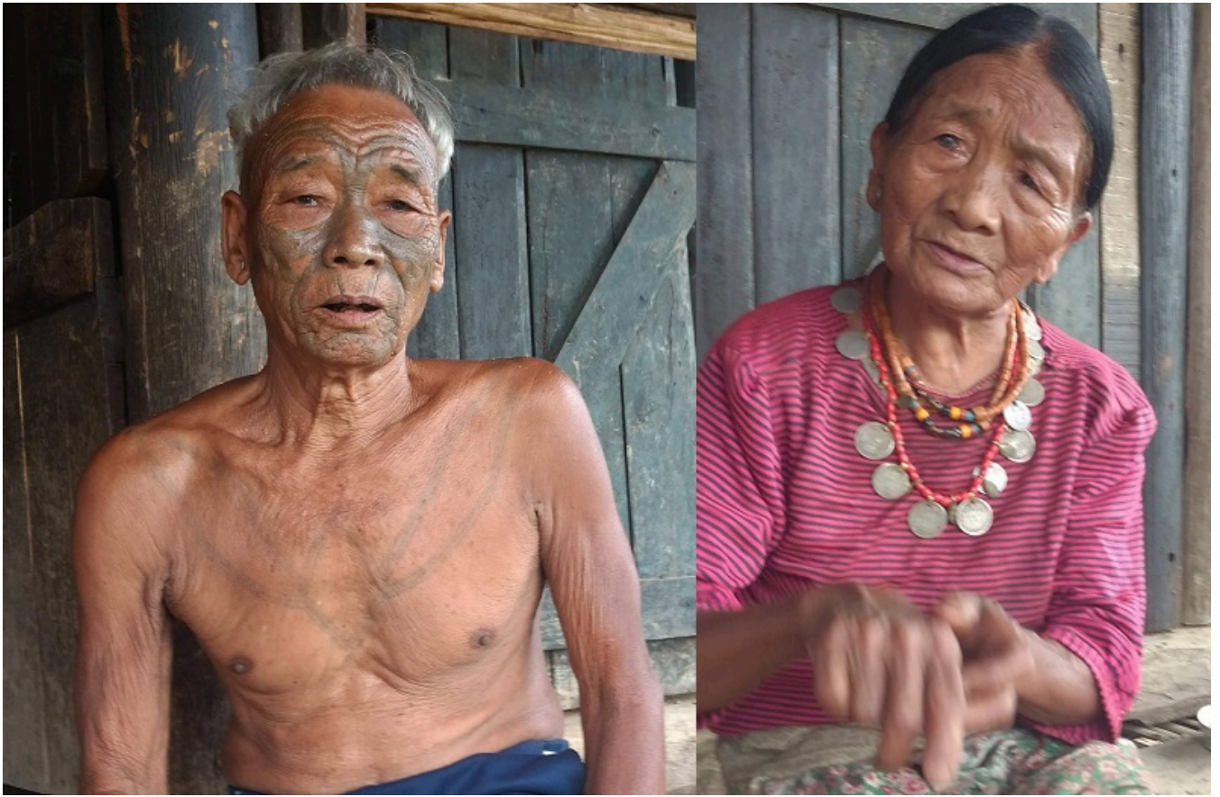
नगालैंड के एक सुदूर गाँव में हेड हंटर और उनकी पत्नी से लेखक की मुलाकात के दौरान ली गई तस्वीर

मुझे नगालैंड के मोन जिले में कुछ बुजुर्ग हो चुके हेड-हंटर्स और उनके आंग (स्थानीय राजा) का साक्षात्कार करने और उनकी कहानियां सुनने का मौका मिला है। उन्होंने भी मुझे बताया था कि वे हेड-हंटिंग के दौरान पुरुषों और स्त्रियों के सिरों में कोई भेद नहीं करते थे। स्त्रियों के सिर का काटा जाना भी उतनी ही 'वीरता' की निशानी था, जितना कि पुरुषों का सिर काटा जाना। कुछ दुर्लभ मामलों में स्त्रियां भी हेड-हंटिंग करने जा रहे लोगों के साथ जाती थीं। आखिर, अंग्रेजी नाटककार जॉन लिली ने 16वीं शताब्दी के अंत में जो लिखा था, वह इन पर भी लागू होता था— “प्रेम और युद्ध में सब चलता है।”