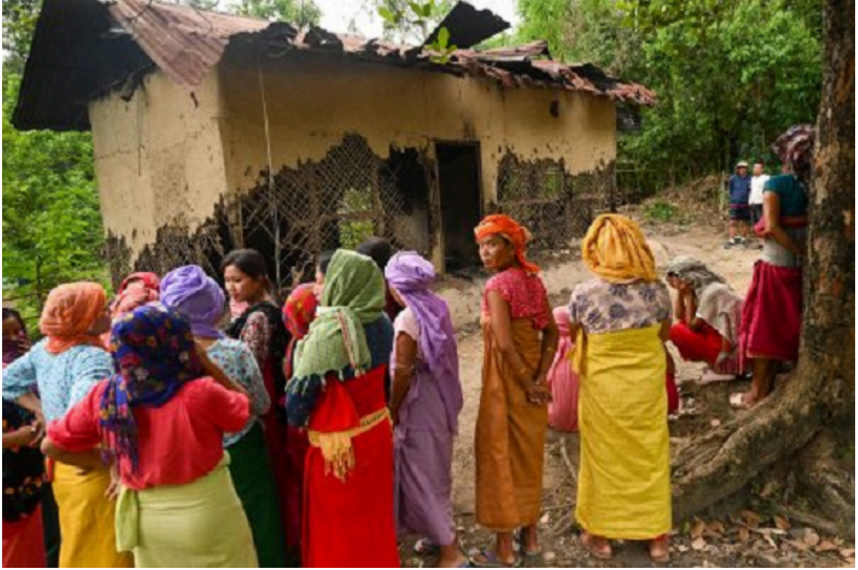
In this photo taken on July 22, 2023, a group of Meira Paibi women of the Meiti community gather in front of the partially charred house of an alleged suspect of a viral sexual assault video in Pechi Awang Leikai

ये महिलाएं 'माइरा पाइबिस' नामक उसी संगठन की थीं जिन्हें मणिपुर की 'महिला मशाल वाहक' कहा जाता है और 2004 में इसी संगठन की सदस्यों ने भारतीय सेना के अत्याचारों के खिलाफ नग्न होकर प्रदर्शन किया था।