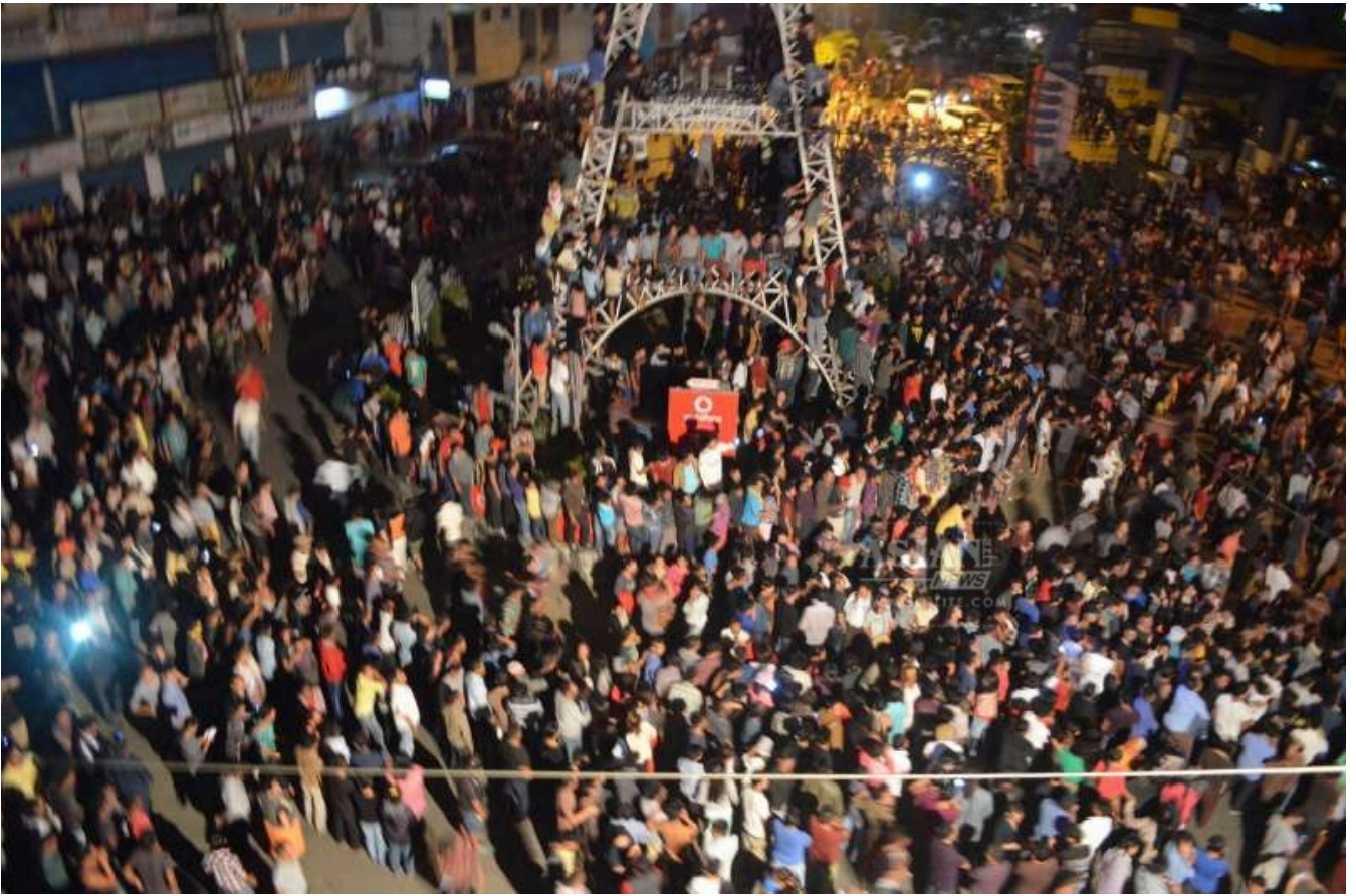
गुस्साई भीड़ ने खून, मांस और धूल से सनी उसकी लाश को सिटी टावर के ऊपर टांग दिया

दीमापुर सेंट्रल जेल में एक 20 वर्षीय सुमी (नगा) युवती के साथ बलात्कार का आरोपी बंद था। उस 35 वर्षीय आदमी ने चार साल पहले उसके गांव की ही एक नगा लड़की से शादी की थी, इस नाते वह उसके घर आता-जाता था। एक दिन उसके एक दोस्त ने उसे झांसे में लेकर कार में बिठाया और एक स्थानीय होटल में पहुंचा दिया, जहां आरोपी पहले से मौजूद था। उसके बाद उस आदमी ने उसे नशीला पदार्थ दिया और कई बार उसके साथ बलात्कार किया। आरोपी के बारे में अफ़वाह थी कि वह बांग्लादेशी है। बाद में मालूम चला कि वह असम का था।