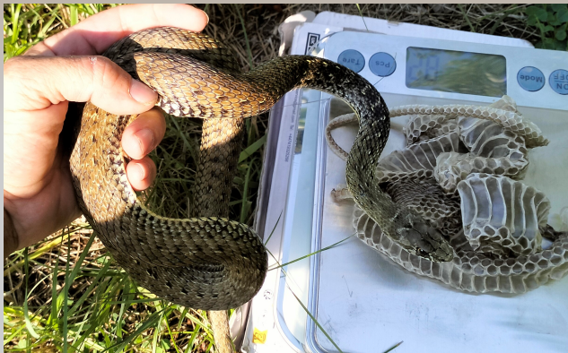
Pesée et relâchée de Léa – 16.06.2023

La couleuvre de Montpellier vit souvent à proximité de l'homme et fait l'objet de nombreux dossiers réglementaires autorisant sa destruction ou sa relocalisation. Ces dernières années, les alertes sur la raréfaction des serpents dans le monde ont conduit à reconsidérer le statut de la couleuvre de Montpellier qui, en Provence, est classée NT (Quasi menacée, UICN, 2017). Suite à un projet d'urbanisation d'habitats naturels et dans le cadre d'une mesure ERC (éviter/réduire/compenser), pour la première fois nous avons déplacé 4 couleuvres de Montpellier et les avons suivi par radio pistage pendant 4 mois. Les premiers résultats montrent que les couleuvres ont entrepris de grands déplacements pendant toute la période d'activité et se sont fixées à partir de la mi août dans des secteurs qu'elles ont choisi.