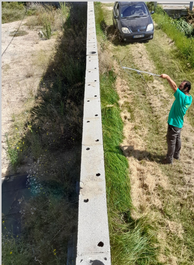
Détection de Maeva dans un jardin à 1,3 km de la zone de relâche – 16.07.2023