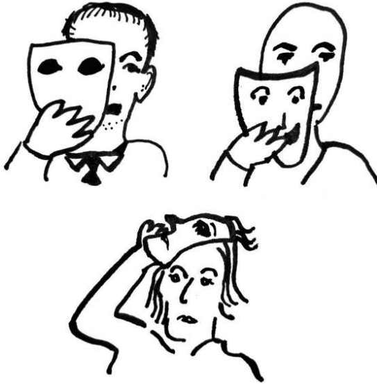
Figure 7. Le masque comme motif du « pervers narcissique »

un « prédateur du quotidien », le « Dracula du XXI e siècle » 70 , un « criminel prédateur » 71 , il cherche à « vampiriser et anémier son partenaire » 72 .