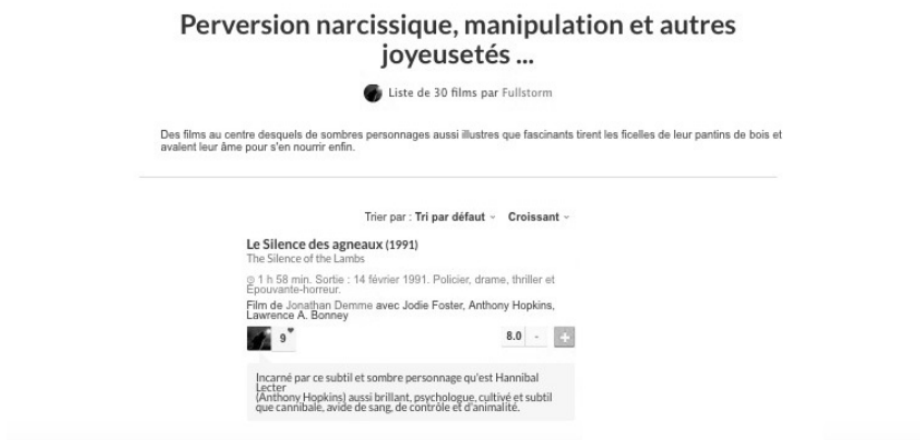
Figure 4. Liste de films intitulée « Perversion narcissique, manipulation et autres joyeusetés... » 35

La page est aussi composée de bannières publicitaires, de compteurs divers (« 13 membres aiment cette liste », « liste vue 49536 fois », « 1 personne n'apprécie pas la liste ») et de renvois vers d'autres listes. Sous l'intitulé « Ses autres listes », on voit des contributions du même auteur. Plus bas, l'intitulé « Listes similaires » suggère des sélections filmiques focalisées sur des thématiques associées au « pervers narcissique » par le dispositif de recommandation : « Top 15 meilleurs méchants », « Les méchants charismatiques », « Comment devenir un psychopathe ? ».