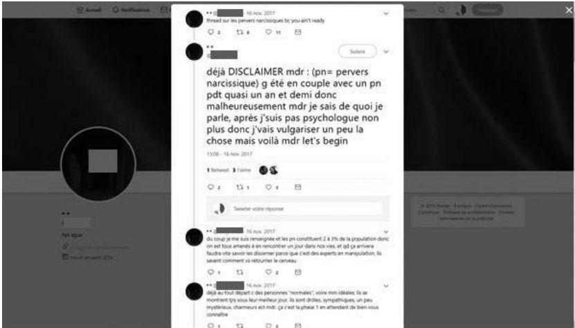
Figure 3. Témoignages sur les « pervers narcissiques » sous la forme de « fil » de tweets : « Thread sur les pervers narcissiques bc you ain't ready ».

Au fil des 27 tweets qui complètent le thread , les « PN » sont décrits de diverses manières : à l'aide de statistiques (« 2-3 % de la population »), de traits psychologiques, d'attitudes ou éléments de personnalité (« ils sont drôles, sympathiques, un peu mystérieux »), d'expériences relationnelles et personnelles (« il va se mettre à vous descendre mentalement »). Entre acronymes (« MDR », « PTDR ») et autres abréviations, le vécu de l'auteurice donne un liant à ces éléments hétérogènes. Au-delà du récit et des anecdotes, des captures d'écran intégrées à ses tweets lui servent d'illustration et de preuves matérielles : deux captures d'écran d'échanges tendus par SMS avec son ex-compagnon authentifient son expérience :