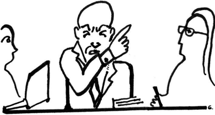
Figure 1. Portrait du « pervers narcissique » en milieu professionnel : d'après « Le pervers narcissique au bureau : le repérer, le combattre », ibid.

Sous le titre, l'article est illustré par une photo qui situe l'un des espaces de vie supposés du « pervers narcissique » : celle-ci représente quatre personnes dans un contexte professionnel. Le personnage central est un homme âgé qui semble, par sa posture et son expression faciale, donner des ordres menaçants aux trois autres, les sourcils froncés et l'index levé en signe de « volonté qui s'impose » (Dontenville-Gerbaud, 2016 : 52). Ces derniers le regardent, ne présentant que leur profil, tenant à la main des papiers froissés : une mise en scène qui pourrait suggérer un travail inutilement réalisé. Crédité « © REA », la photo provient de l'agence du même nom. Une recherche inversée sur le moteur de recherche Google Images indique que les mots clés « vieux manager » lui sont associés et révèle l'usage récurrent de l'image pour illustrer d'autres articles de Capital.fr sur des thématiques similaires (« Protégez-vous de vos collègues toxiques » 25 , « Cinq trucs pour manager une équipe de vieux briscards » 26 , « Les brutes dans l'entreprise... à ne pas confondre avec les pervers » 27 ).