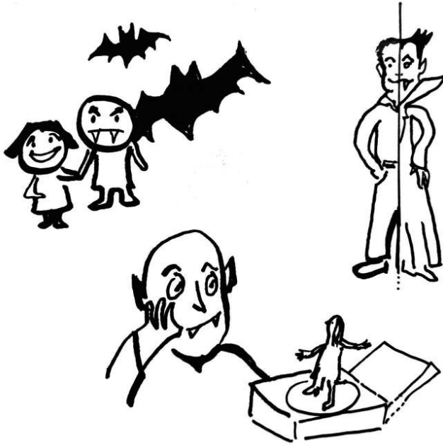
Figure 8. Le vampire comme motif du « pervers narcissique »

On retrouve donc dans la presse cette formule si facilement mobilisée dans la vie quotidienne. Pour comprendre comment elle est devenue un référent social tout en conservant une dimension polémique (Krieg-Planque, 2009), il nous a fallu dépasser cette première lecture linéaire qu'offre la constitution et l'analyse systématique du corpus, pour envisager les arts de faire (de Certeau, 1980) du chiffonnier (Benjamin, 2000). Rassembler les débris glanés lors d'explorations sur l'internet, amasser les rebuts qui ont trait au « pervers narcissique », faire collection de morceaux choisis dans ce capharnaüm : il ne s'agit plus de comprendre le « pervers narcissique » dans son figement, aussi fragile soit-il, mais de suivre le sillon de ses médiations pour mieux saisir sa figure à travers ses incarnations et ses supports. Ni exhaustivité ni représentativité, cette démarche « située » en appelle à la méticulosité et à l'exploration, tantôt face aux portraits triviaux qui instancient un « pervers narcissique » (au travail, en amour ou en fiction), tantôt face aux motifs qui le donnent à imaginer sous un angle intimidant (manipulation, dissimulation, prédation). En s'arrêtant sur le détail du geste de la figuration, sur le travail des supports, sur les résonances entre incarnations, c'est toute l'ampleur et la duplicité de la figure du « pervers narcissique » qui apparaît.