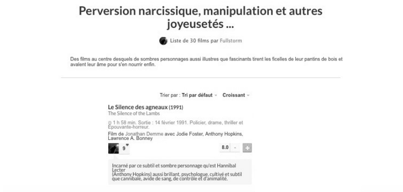
Figure 4. Liste de films intitulée « Perversion narcissique, manipulation et autres joyusetés... » 35

La page est aussi composée de bannières publicitaires, de compteurs divers (« 13 membres aiment cette liste », « liste vue 49536 fois », « 1 personne n'apprécie pas la liste ») et de renvois vers d'autres listes. Sous l'intitulé « Ses autres listes », on voit des contributions du même auteur. Plus bas, l'intitulé « Listes similaires » suggère des sélections filmiques focalisées sur des thématiques associées au « pervers narcissique » par le dispositif de recommandation : « Top 15 meilleurs méchants », « Les méchants charismatiques », « Comment devenir un psychopathe ? ».