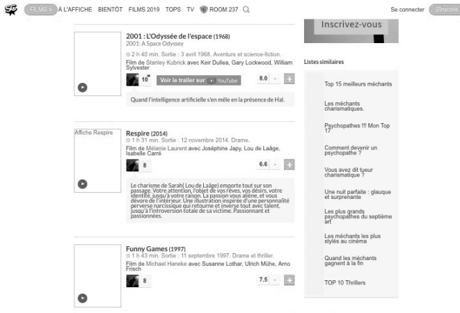
Figure 5. Films de la liste « Perversion narcissique, manipulation et autres joyeusetés... », ibid

La zone « commentaires » en bas de page donne lieu à des suggestions pour l'inclusion ultérieure d'autres films dans la liste : « J'ai un nouveau film pour ta liste : Respire – de Mélanie Laurent. ;-) » 36 écrit l'internaute Pacomm. Ces rapprochements thématiques sont propres aux cinéphilés pris au sein d'une plateforme comme SensCritique qui ne cesse de valoriser leur statut d'« éclaireurs », la plus-value de leurs gestes de mise en collection, notation, évaluation et recommandation. Ces mêmes gestes les conduisent à compiler a posteriori une filmographie (1955-2014) consacrée aux « pervers narcissiques » sur une étendue forcément anachronique. Cette collection d'amateurs, dont la dimension éclairée est soutenue par les fonctionnalités du site internet, étend donc le spectre du « pervers narcissique » à l'ensemble de la création cinématographique, attestant son existence supposée bien avant son énonciation dans les années 1980.