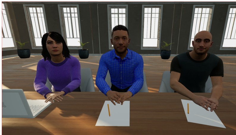
Fig. 3. Simulation d'entretien d'embauche

que le statut de l'agent virtuel (employeur ou employé). L'utilisateur aura la possibilité par la suite de passer en entretien avec des recruteurs virtuels interactifs. Toutefois, les interventions verbales de l'agent seront contrôlés à distance, voir Figure 3