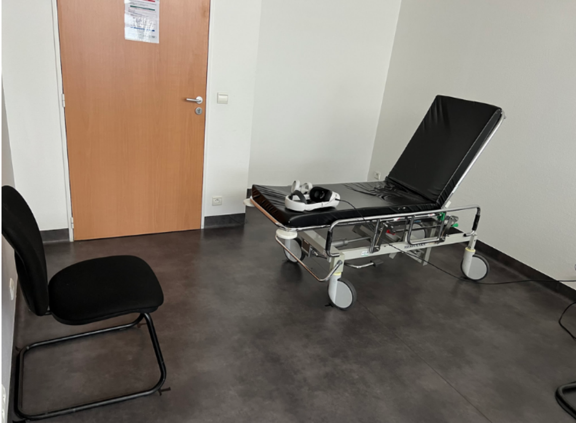
Fig. 4. Le matériel expérimental nécessaire pour l'étude OPEVA est constitué d'une chaise sans accoudoir, d'un brancard, d'un casque de réalité virtuelle type Oculus Quest, et d'un ordinateur.