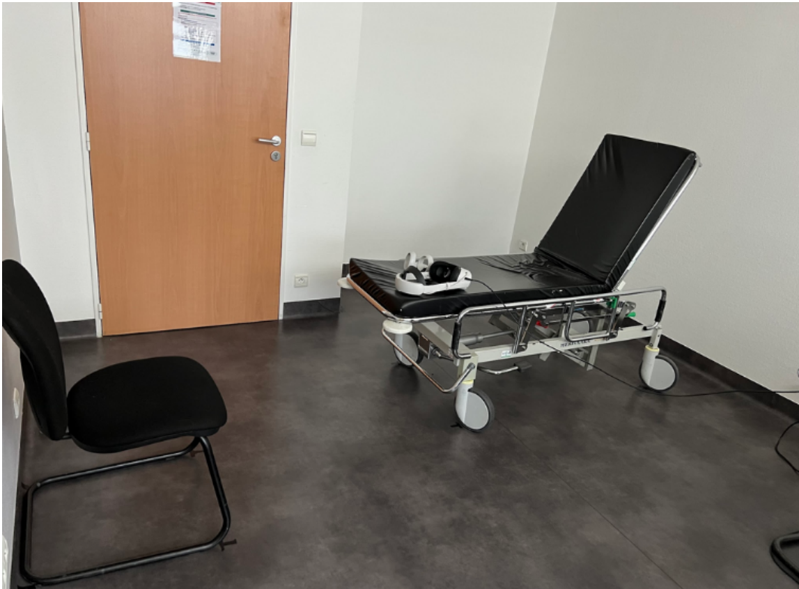
Fig. 4. Le matériel expérimental nécessaire pour l'étude OPEVA est constitué d'une chaise sans accoudoir, d'un brancard, d'un casque de réalité virtuelle type Oculus Quest, et d'un ordinateur.