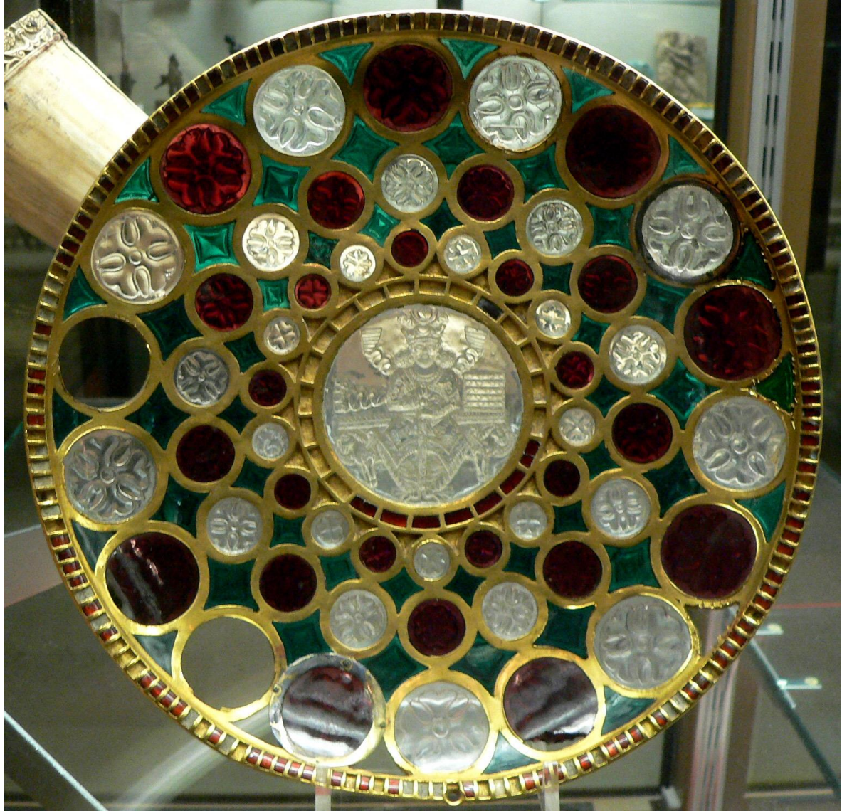
Coupe de Chosroes, VI e -VIII e siècle Cabinet des médailles, Bibliothèque National de France