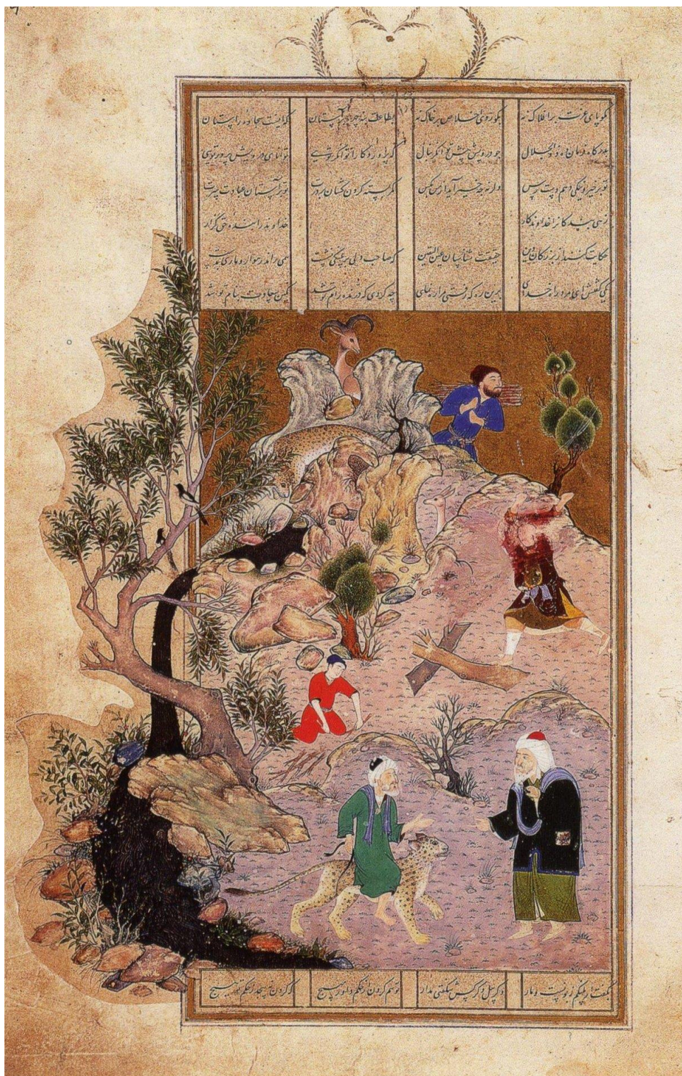
Le Mystique qui chevauchait une panthère

Page d'un manuscrit du Bustân de Sa'di (Herat, 1525)