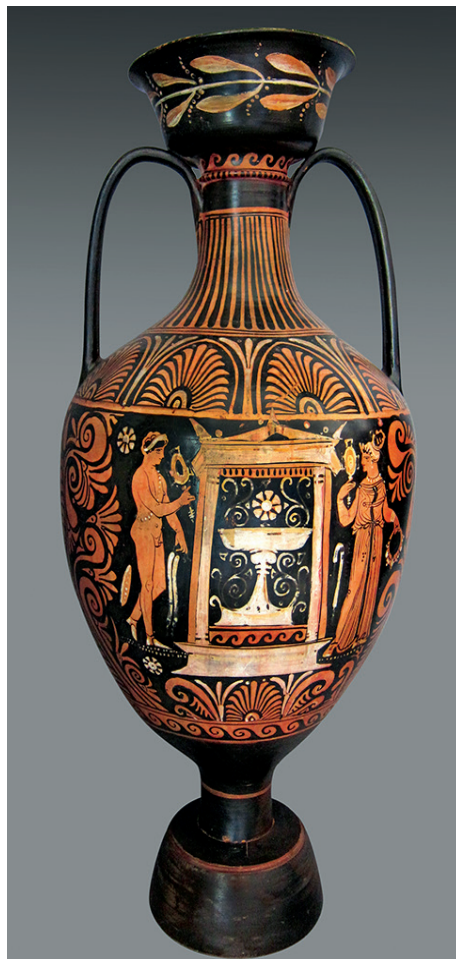
Figure 5 : Amphore pseudo-panathénaique apulienne, attribuée au Peintre de Berlin F 3383 (vers 320 av. J.-C.). Naples MANN 82308.