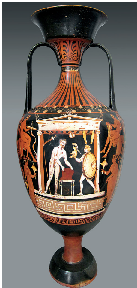
Figure 4 : Amphore pseudo-panathénaique apulienne, attribuée au Peintre de Chiesa (vers 340 av. J.-C.). Naples MANN 82383.