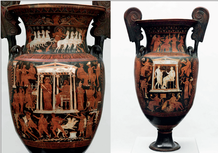
Figure 2 : Cratère à volutes apulien, œuvre éponyme du Peintre des Enfers (vers 330-320 av. J.-C.). Faces A et B. Munich Antikensammlungen 3297.