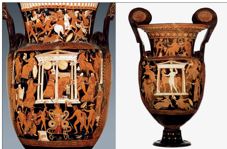
Figure 1 : Cratère à volutes apulien, attribué au Peintre des Enfers (vers 330-320 av. J.-C.). Faces A et B. Munich Antikensammlungen 3296.

On reconnaît aisément sur le cratère à volutes de Munich (fig. 1) l'épisode de la vengeance de Médée, qui tue Créüse avec la couronne empoisonnée qu'elle avait offerte à sa jeune rivale à l'occasion de son union avec Jason. La jeune fille est représentée sous une architecture qui symbolise le palais du roi de Corinthe, gisant déjà sans vie dans les bras de son père Créon, tandis que son frère Hippotès se précipite vers elle. Le meurtre des enfants est aussi évoqué par la violence du geste de Médée qui empoigne son fils par les cheveux et s'apprête à l'immoler sur un autel 11 . L'évocation de l' eidôlon Aetow 12 complète la vision tragique par la présence du fantôme du père de Médée. Ainsi que l'explique Agnès Rouveret, « l' eidôlon est la manifestation visuelle de ce qui reste du vivant après la mort 13 . Et c'est sous ce terme que sont aussi nommées les apparitions dans