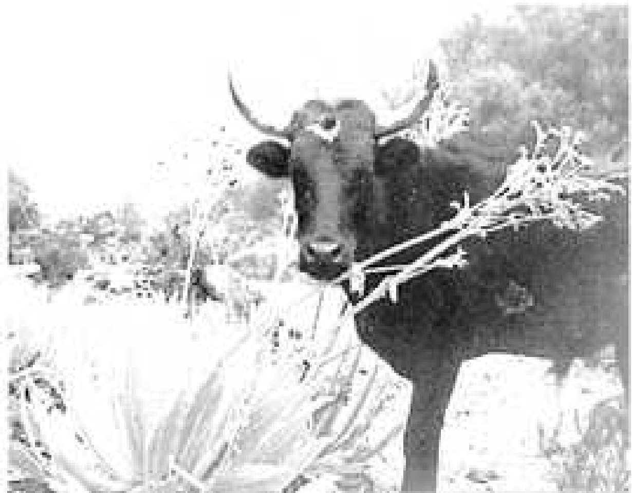
Photo 1 : Jeune taureau rencontré dans la montagne, un apprivoiseur du páramo ? (la plante est un frailejon, Espeletia Schultzii ).