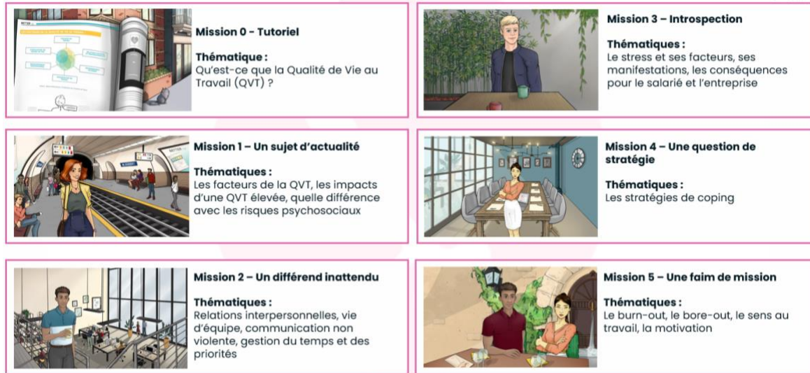
Figure 1 : Liste des missions proposées dans Work In Balance

Notre serious game « Work In Balance » est donc constitué d'un tutoriel et de cinq missions portant respectivement sur les thématiques suivantes, en lien avec le contenu des entretiens : 1) qualité de vie au travail de manière générale ; 2) conflit interpersonnel au sein d'une équipe ; 3) stress professionnel ; 4) stratégies de coping associées à la gestion du stress ; 5) charge de travail, sens au travail et motivation.