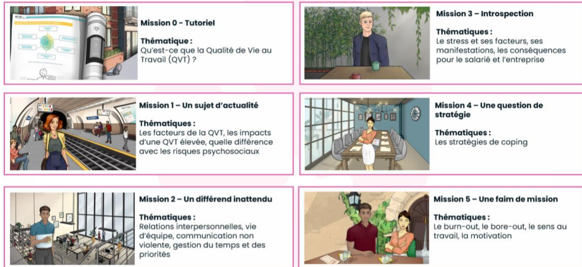
Figure 1 : Liste des missions proposées dans Work In Balance

Notre serious game « Work In Balance » est donc constitué d'un tutoriel et de cinq missions portant respectivement sur les thématiques suivantes, en lien avec le contenu des entretiens : 1) qualité de vie au travail de manière générale ; 2) conflit interpersonnel au sein d'une équipe ; 3) stress professionnel ; 4) stratégies de coping associées à la gestion du stress ; 5) charge de travail, sens au travail et motivation.