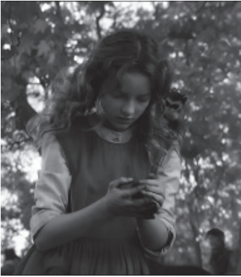
Fig 1. Lyra, incarnée par Dakota Blue Richards dans le film de 2007.