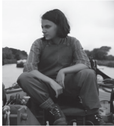
Fig 2. Lyra, jouée par Dafne Keen dans la série HBO de 2019.

comparée dans l'incipit du premier tome. L'adaptation de HBO s'écarte davantage des codes de représentation traditionnels de la fillette classique : on a cette fois une Lyra (jouée par Dafne Keen) aux cheveux courts, au regard sombre et portant principalement des pantalons, des salopettes et autres vêtements fonctionnels et confortables (sauf lorsque cela est scénaristiquement justifié, par exemple lors de son séjour à Londres chez M me Coulter qui l'initie à la vie mondaine).