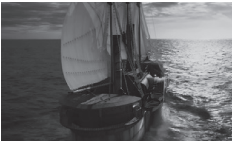
Fig 5. Le bateau du peuple des gitans tel qu'il est représenté dans le film de 2007.