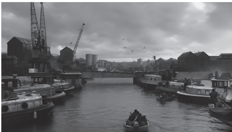
Fig 4. Les péniches du peuple des gitans dans la série de 2019.