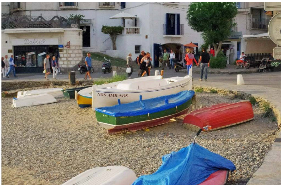
Photo n° 2 : Embarcation portant pour nom la devise du village (Cadaqués)