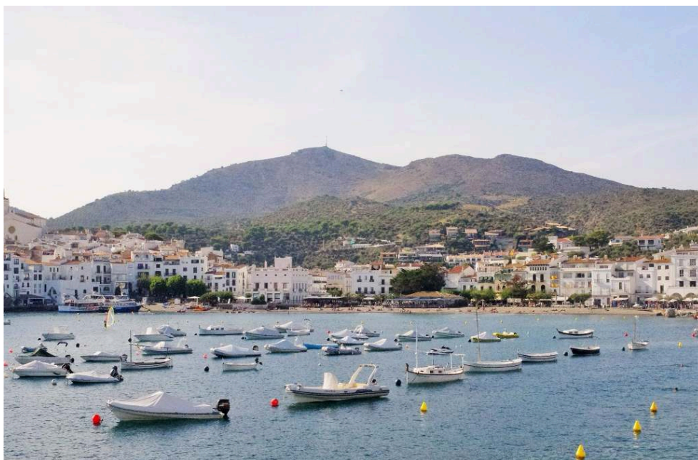
Photo n° 1 : La place principale du village depuis la baie (Cadaqués, Espagne)

boliviens sont enregistrés à Cadaqués et ils constituent la première nationalité étrangère de la ville. Compte tenu de la diversité sociale, liée en partie à une vingtaine de nationalités résidentes, le village doit aujourd'hui composer avec différentes modalités de l'habiter (Bour, 2013) et du travail. Interroger ces manières d'habiter et de travailler - notamment celles des Boliviens - me permet de questionner plus généralement les transformations de ce village dans la mondialisation.