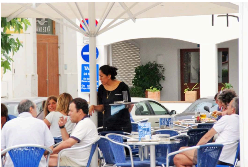
Photo n° 3 : Une bolivienne employée comme serveuse dans un bar (Cadaqués)