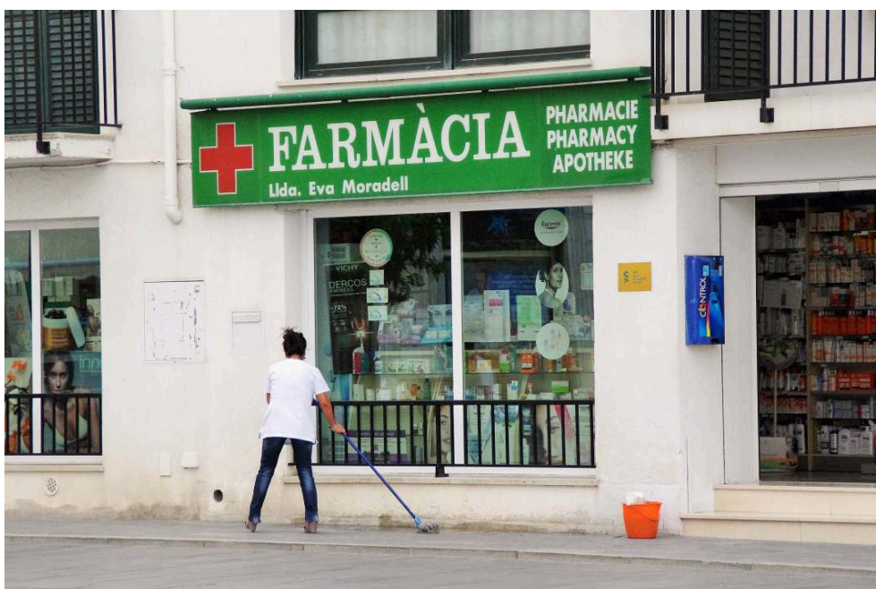
Photo n° 4 : Une bolivienne employée dans une pharmacie (Cadaqués)