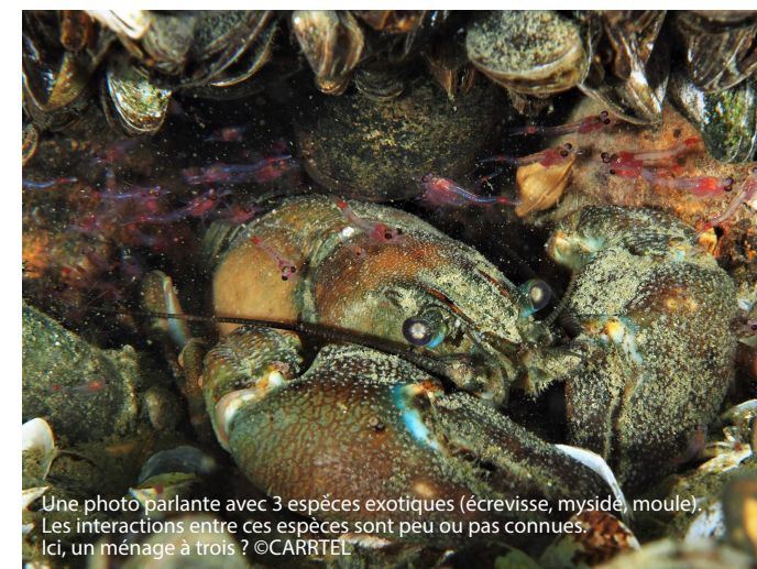
Une photo parlante avec 3 espèces exotiques (écrevisse, mysid, moule). Les interactions entre ces espèces sont peu ou pas connues. Ici, un ménage à trois ?

On l'aura compris, Le Léman (et les autres grands lacs périalpins) est régulièrement colonisé par de nouveaux arrivants. Certaines de ces espèces exogènes sont