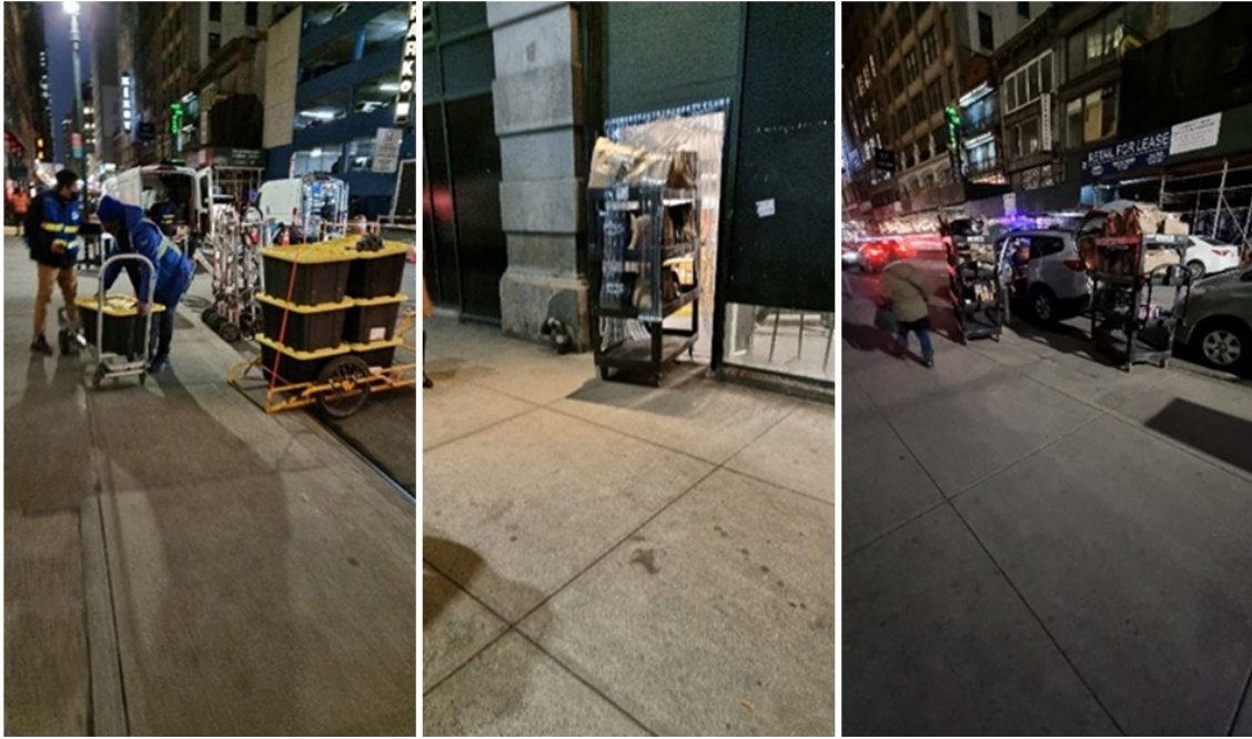
11. Scènes de la vie logistique ordinaire à New York aux abords de l'entrepôt urbain d'Amazon à Manhattan (Matthieu Schorung, février 2022)

Le plus frappant, au-delà de cette hybridation, est l'impression de « débrouille » qui s'applique dans la gestion du dernier kilomètre et dans la livraison des commandes faites en ligne. En effet, on constate qu'il n'existe aucun aménagement spécifique pour faciliter les opérations et le travail des manutentionnaires : il n'y a ni parking aménagé, ni aire de chargement. Toutes ces opérations se font à même la rue, au milieu des passants et du trafic automobile régulier (photo n°11 droite). Le matériel est également garé ou stocké à l'extérieur de l'entrepôt sur la voie publique (photo n°11 gauche). Cette première impression a été consolidée par l'observation d'opérations de transbordement à même la rue et le trottoir. Enfin, mes observations à proximité de cet entrepôt urbain Amazon m'ont permis de constater le fonctionnement de deux services d'Amazon de manière complémentaire, à la fois la sortie de commandes « Amazon Prime » (service de livraisons rapides) de l'entrepôt tel que le montre la photo n°11 au centre, et le chargement de commandes Amazon Prime dans un véhicule de particulier dans le cadre d'Amazon Flex (photo n°11 à droite).