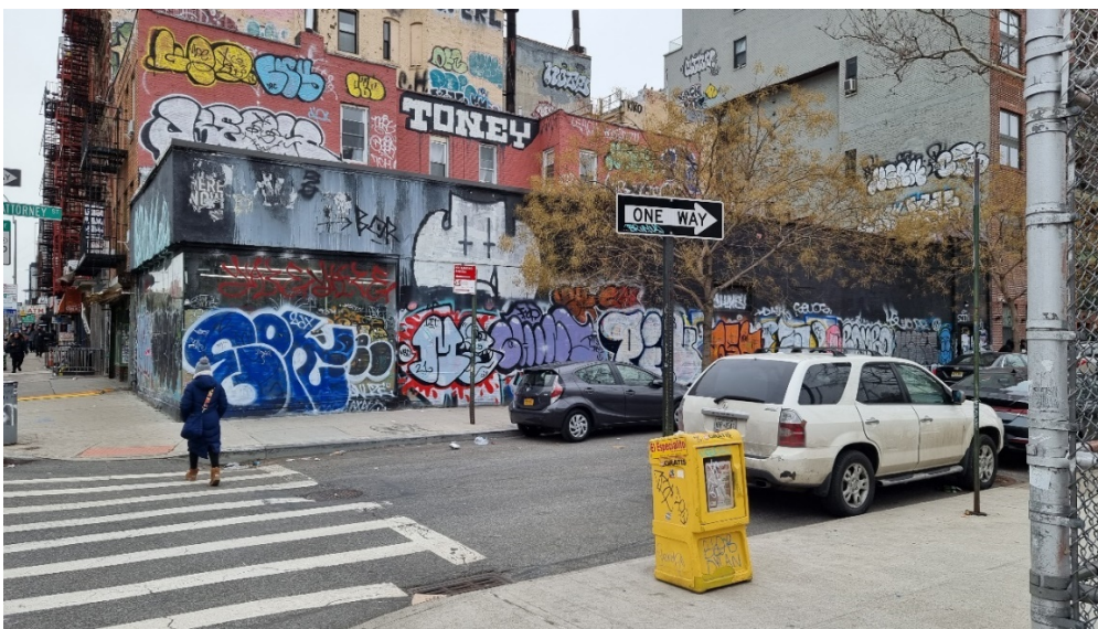
14. Un secteur en évolution rapide : un opportunisme commercial pour répondre à une croissance fulgurante. Le cas du dark store Buyk dans le Lower East Side (Matthieu Schorung, février 2022)

activités : Buyk et Fridge No More ont annoncé dès mars leur retrait du marché américain et la fermeture de tous leurs sites. Néanmoins, l'exemple du site de Buyk (photo n°14) dans le Lower East Side (au 178 Delancey Street) est emblématique de l'opportunisme commercial du quick commerce de trouver des sites, facilement aménageables, à proximité des grandes artères et des quartiers d'habitation. La photo n°14 montre un dark store de Buyk ouvert en 2021, sur l'emplacement d'un commerce vacant. On constate que ce site n'a fait l'objet d'aucun réaménagement extérieur, pour effacer les stigmates manifestes d'une vacance commerciale et de l'absence d'entretien du bâtiment, et seul un petit panneau portant le logo Buyk à l'entrée indique la présence du quick commerçant. Cet exemple de dark store témoigne du fait que les notions de vitesse et de flexibilité apparaissent être au cœur de la stratégie des quick commerçants : dès qu'un site adapté est identifié, un quick commerçant s'empresse de louer la surface commerciale et la transforme de manière rapide (et souvent à bas coûts avec des installations assez simples : étagères, tables, rangée de réfrigérateurs pour les produits frais et équipements internet et numériques). L'entreprise locataire ne se préoccupe ni d'aménagements extérieurs, ni de rénovation de la surface.