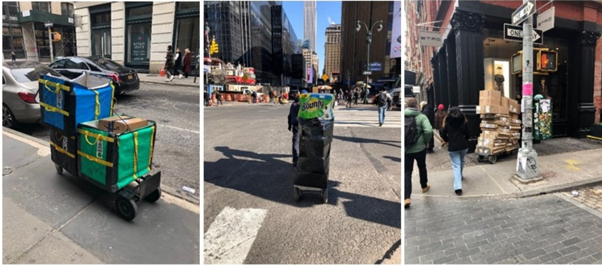
10. Le retour des porteurs ? La multiplication dans l'espace public new-yorkais des livreurs à pied, souvent aidés de chariots pour transporter les colis dans leur tournée des derniers mètres (Matthieu Schorung, février 2022)

motorisation, et qui font leur grand retour pour répondre à la multiplication des livraisons urbaines. On assiste donc à la (ré)émergence d'une catégorie de travailleurs, effectuant des tâches difficiles, répétitives, soumis aux intempéries et aux aléas de la circulation (sur la route comme sur les trottoirs) – catégorie faisant de manière lointaine écho aux portefaix du Moyen-Âge et de la Renaissance qui portaient les charges lourdes (les fardeaux) dans les villes (Libeskind, 2021). Marcher dans Manhattan consiste donc à croiser des dizaines et des dizaines de livreurs à pied, qui ont pour mission de livrer les colis dans une zone prédéfinie – zone qui a priori ne dépasse pas quelques îlots. Une fois que le livreur a vidé l'ensemble de ses caissons, il repart rejoindre le prochain point de transbordement.