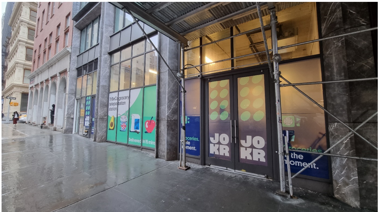
Couverture : Un dark store JOKR à New York (Manhattan) (Matthieu Schorung, février 2022)

Pour citer cet article : Schorung, M., 2023, « Portfolio : Le e-commerce à New York : quelle empreinte sur l'espace public ? », Urbanités , Vu, mars 2023, en ligne .