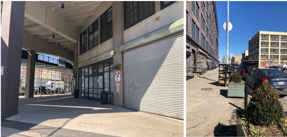
4. Un entrepôt très discret d'Amazon à Brooklyn, dans le quartier de Red Hook (Dablanc, février 2022)

De plus en plus d'entrepôts en zone péricentrale sont construits, dans le Bronx secondairement, mais surtout à Brooklyn. La photo n°4 témoigne de cette implantation privilégiée en zone péricentrale, proche de Manhattan. Il s'agit, à nouveau, d'un entrepôt Amazon, qui sert de centre de distribution, prioritairement pour deux services : Amazon Flex et Amazon Fresh (service de livraisons instantanées d'Amazon notamment pour les produits frais et les courses alimentaires d'appoint). Ce qui frappe en se déplaçant autour du bâtiment, c'est la très grande discrétion de la marque, sans sigle, sans panneau, avec un seul petit affichage discret sur la porte. En outre, la récupération des cargaisons pour Amazon Flex, qui sont préparées dans l'entrepôt et déplacées sur des chariots noirs (l'un est visible sur la photo de droite), se fait directement dans la rue adjacente, sans aucun aménagement spécifique pour aider à la manœuvre des chariots. Par observation, on peut comptabiliser sur un chariot jusqu'à 60 sacs et chaque chariot est destiné à un livreur-particulier qui effectue ensuite une tournée jusqu'à une dizaine de clients.