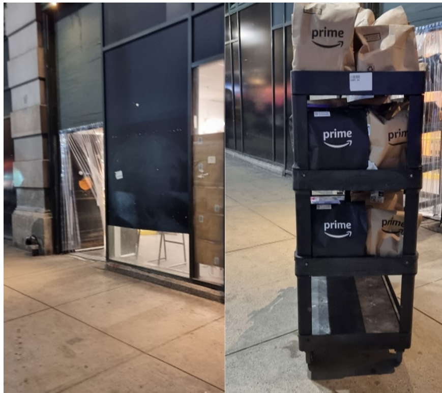
7. Les activités aux abords du bâtiment témoignent de la présence de l'entreprise en comparaison d'une façade neutralisée

Le bâtiment est en lui-même imposant, typique des façades en pierre de taille avec de larges baies vitrées du quartier, occupant plus de la moitié de l'îlot ( block ). L'entrepôt est alimenté par des camions entrant par une seule grande porte et les marchandises sortent, empaquetées, sur les mêmes chariots noirs que