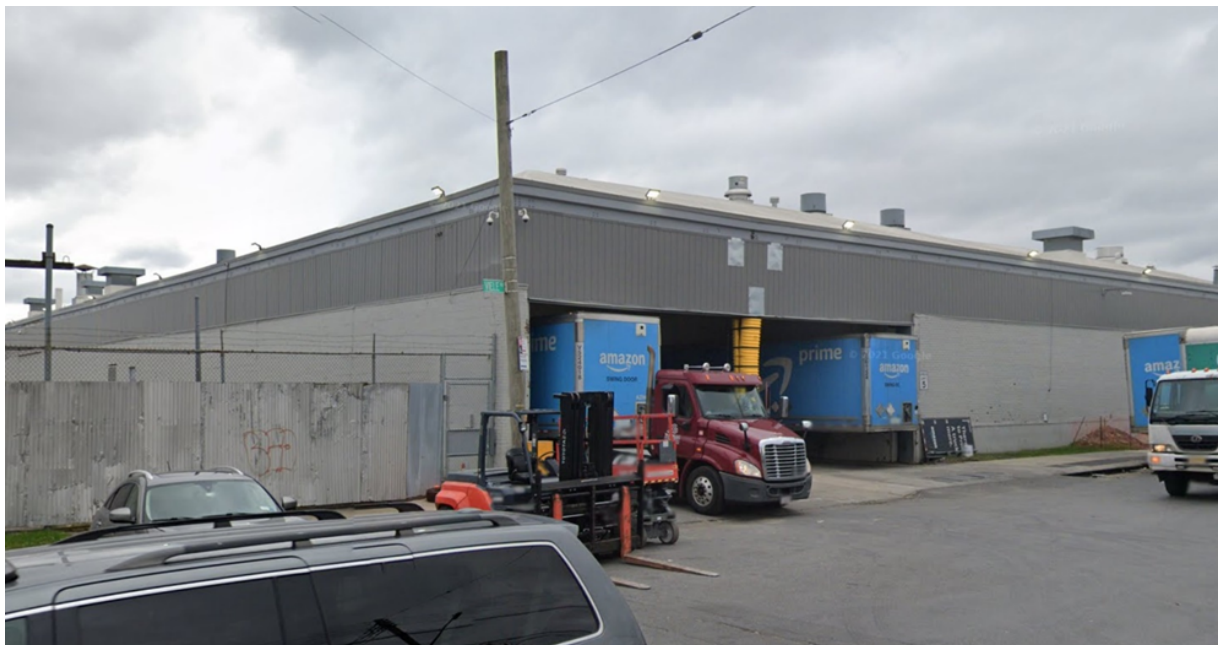
3. Un centre de distribution intermédiaire d'Amazon dans la zone péricentrale nord dans le quartier de Hunts Point (Bronx) (Matthieu Schorung, février 2022)

Mes pérégrinations à New York m'ont conduit à observer des entrepôts intermédiaires dans la couronne péricentrale ainsi que dans Manhattan. D'abord, un centre de distribution intermédiaire d'Amazon à Hunts Point dans le Bronx. Celui-ci est de taille bien plus modeste que les précédents entrepôts présentés précédemment et se situe dans une zone industrielle du Bronx, à proximité relative de Manhattan. Il assure un double rôle : un centre de tri et de distribution à destination de micro-hubs locaux et pour charger des camionnettes pour la livraison finale à Manhattan ; un centre de récupération de colis pour les particuliers-livreurs qui ont une activité secondaire de livraison. La photo n°3 montre l'arrière du centre de distribution, là où les poids lourds d'Amazon (ceux-là étaient estampillés de la marque avec la nuance de bleu caractéristique de la flotte d'Amazon) approvisionnent le centre et déchargent les marchandises. De l'autre côté du bâtiment, sur la façade avant, j'ai pu observer une file de véhicules de particuliers qui attend de pouvoir récupérer les colis qui leur ont été attribués dans le cadre d'Amazon Flex (prise en charge de commandes et de livraisons, proposée par Amazon, par des particuliers qui peuvent avoir une activité complémentaire par simple engagement numérique sur une application dédiée) – un employé du centre à l'extérieur se charge de la circulation au niveau de la rue.