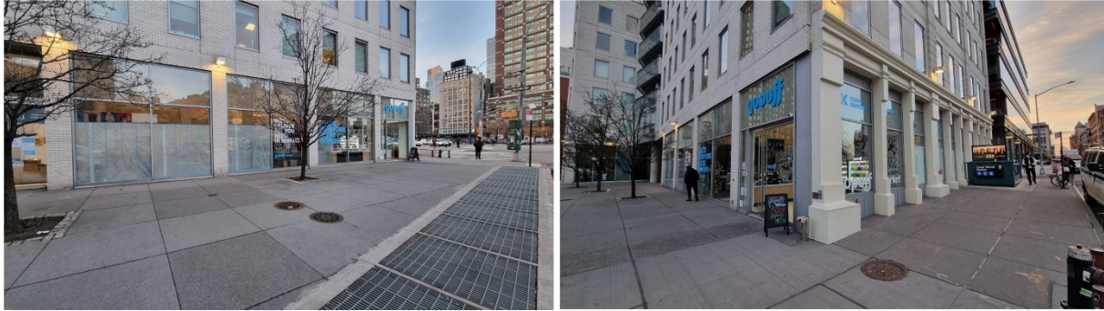
15. Une stratégie d'adaptation face aux critiques : l'exemple de Gopuff Market (Matthieu Schorung, février 2022)