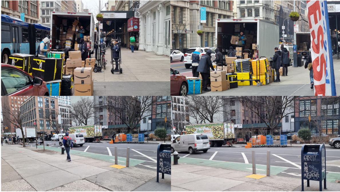
12. Des transbordements à même le trottoir : un problème d’occupation de l’espace public ? (Matthieu Schorung, février 2022)

En effet, sur les deux photographies en haut (photos n°12), on constate au concret l’organisation du transbordement et de la répartition des commandes auprès des livreurs. Là encore, une forme d’hybridation entre utilisation poussée du numérique et débrouille ressort. Le chauffeur doit vider son camion, à même la route et le trottoir – remarquons au passage que les camions sont pleins à craquer, donnant un aperçu de la massification des achats en ligne. On observe une employée d’Amazon à la droite du camion qui a un pad numérique dans les mains, qui est chargée de scanner les colis et de les répartir en fonction de la répartition de la tournée opérée par le logiciel. Par la suite, les colis sont répartis auprès de chaque livreur qui se situe dans la zone et repart avec un à trois caissons de couleur, soit à pied avec un chariot, soit à vélo. Lors de cette seule journée de visite, je suis tombé à quatre reprises sur cette scène, avec parfois une occupation encore plus importante du trottoir jonché de colis Amazon.