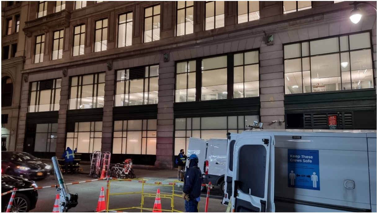
6. Le Amazon distribution center de la 35 ème rue (entre les 5 ème et 6 ème avenues) implanté en plein cœur de Manhattan (Matthieu Schorung, février 2022)