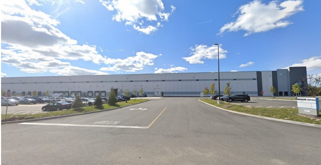
1. Amazon Fulfillment Center à Newark à proximité de l'aéroport Newark Liberty International (Matthieu Schorung février 2022)