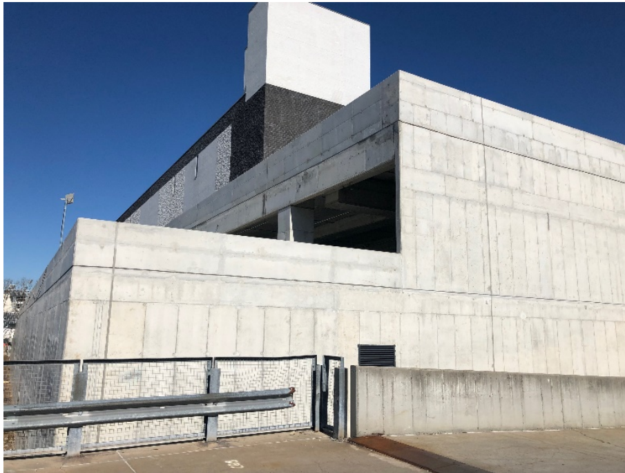
5. Brooklyn comme nouvelle centralité logistique à New York : le projet en construction 640 Columbia Street dans le quartier de Red Hook (Dablanç, février 2022)