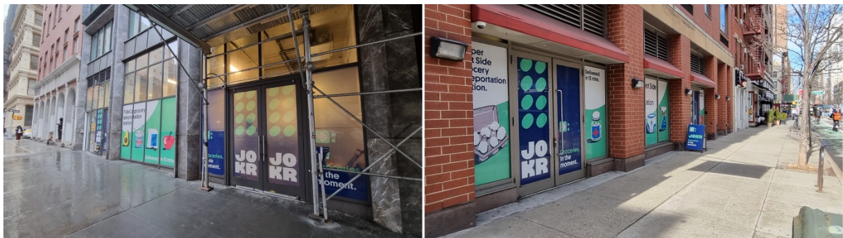
13. Deux dark stores JOKR à Manhattan (Matthieu Schorung, février 2022)

Enfin, parmi l'un des derniers marqueurs du e-commerce identifiés à New York, j'ai pu constater la présence de plus en plus forte de start-up relevant du quick commerce (branche du secteur de l'alimentaire en ligne qui propose la livraison instantanée, inférieure à 20 minutes, de courses d'appoint), notamment JOKR, Gopuff, Getir (Schorung, Buldeo Rai et Dablanc, 2022).