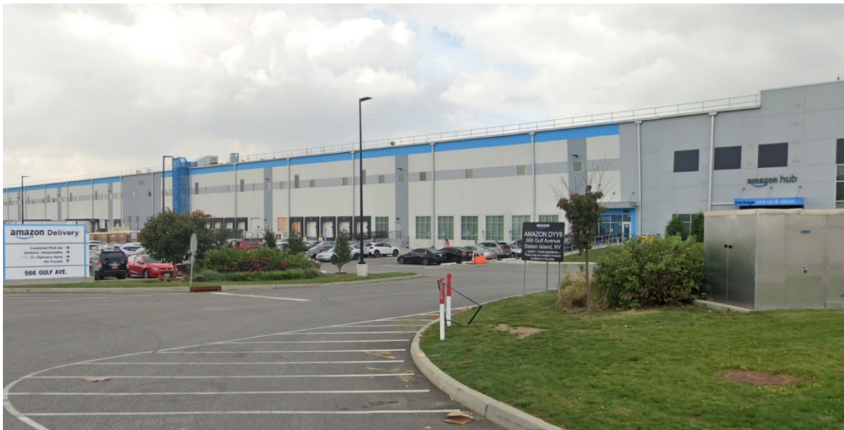
2. Amazon Hub (Delivery & Distribution) situé en face d'un grand centre de distribution à Staten Island (Matthieu Schorung, février 2022)