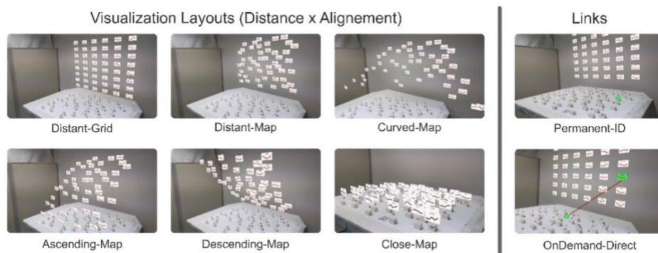
Figure 3 : Conditions de l'étude 2

La seconde étude reprend les meilleurs résultats de liens obtenus lors de la première étude et compare cette fois ci différents layouts (Figure 3) entre eux en en faisant varier les différentes valeurs de localisation de l'espace de conception. Il ressort alors que Descending-Map est le meilleur layout en termes de performance et de préférence.