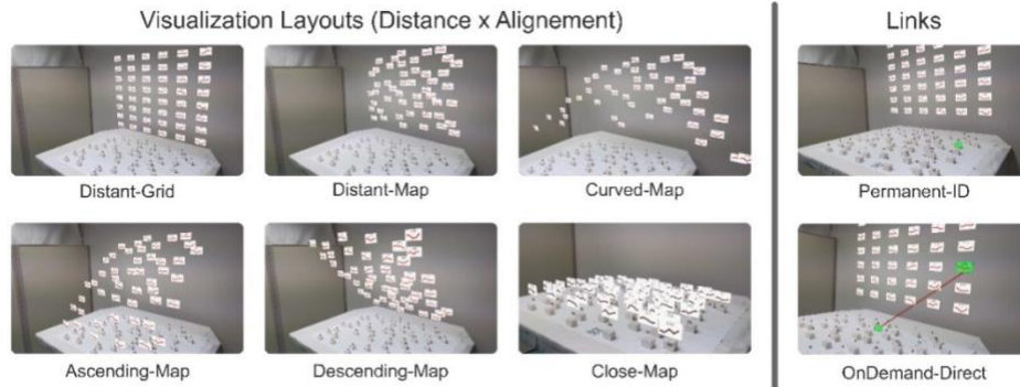
Figure 3 : Conditions de l'étude 2

La seconde étude reprend les meilleurs résultats de liens obtenus lors de la première étude et compare cette fois ci différents layouts (Figure 3) entre eux en en faisant varier les différentes valeurs de localisation de l'espace de conception. Il ressort alors que Descending-Map est le meilleur layout en termes de performance et de préférence.