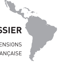
FIGURE 1. LE PARC AMAZONIEN DE GUYANE ET LES COMMUNAUTÉS LOCALES SELON LA CHARTE DE 2012