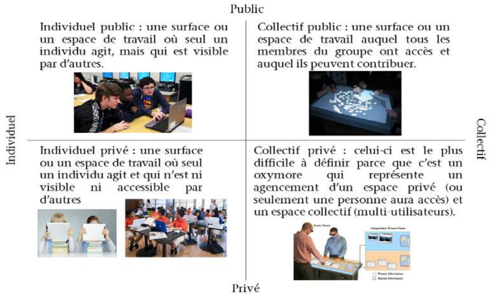
Figure 1 - Les espaces physiques-numériques de travail (Tucker, 2020)

L'espace collectif privé nécessite un agencement spécifique qui se produit lorsqu'un travail individuel, par exemple une recherche d'information sur des fichiers personnels, est réalisé sur une surface partagée, par exemple une table ou tableau. Roman Lissermann et ses collègues (2014) montrent un autre exemple d'un tel espace de travail avec l'agencement d'une table multiutilisateurs (collectif-public) ayant un espace privé accessible avec des lunettes de réalité augmentée (individuel-privé).